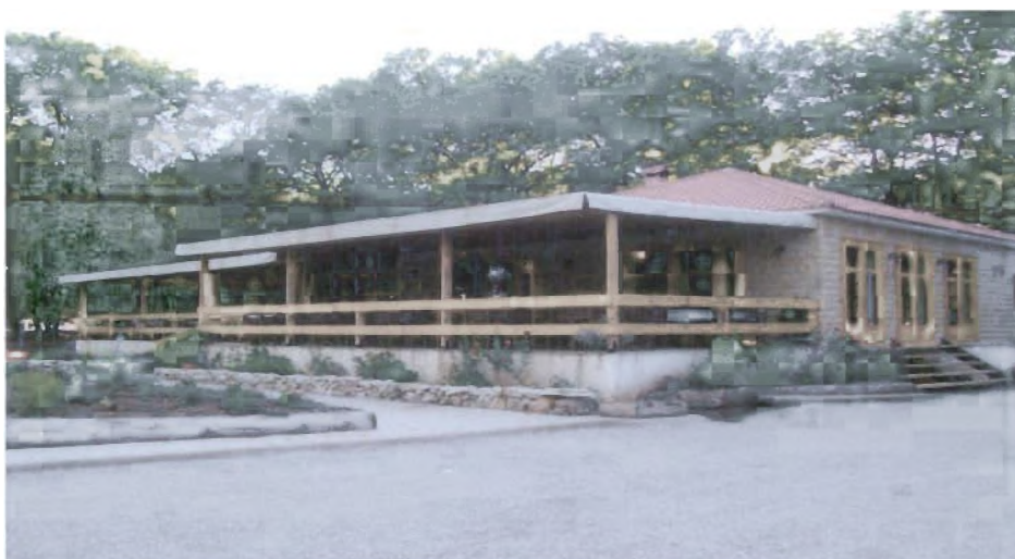
Κούμανι- Δήμου Φολόης: Αναψυκτήριο Κούμανι