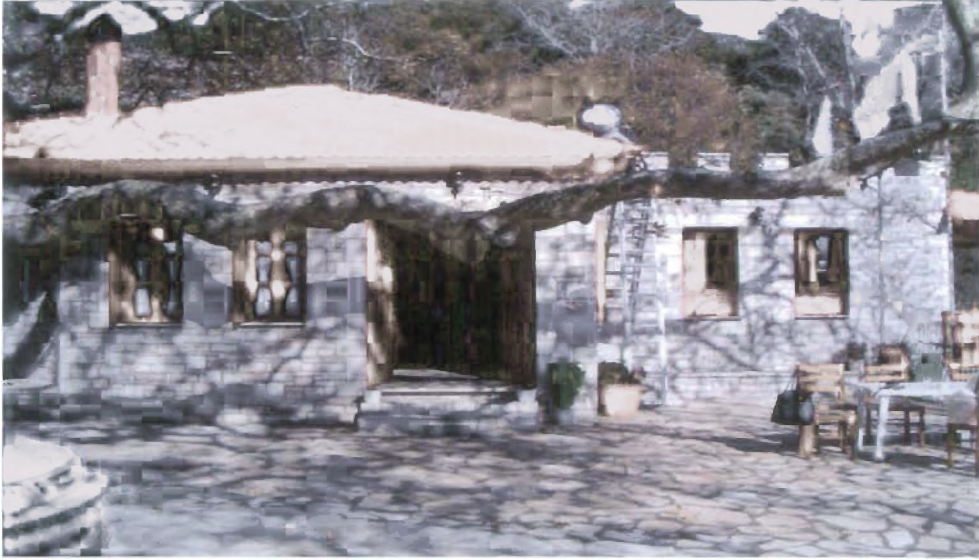
Λινίσταινα-Δήμος Ανδρίτσαινας: Παραδοσιακό καφενείο-ταβέρνα (εξωτερικός χώρος)