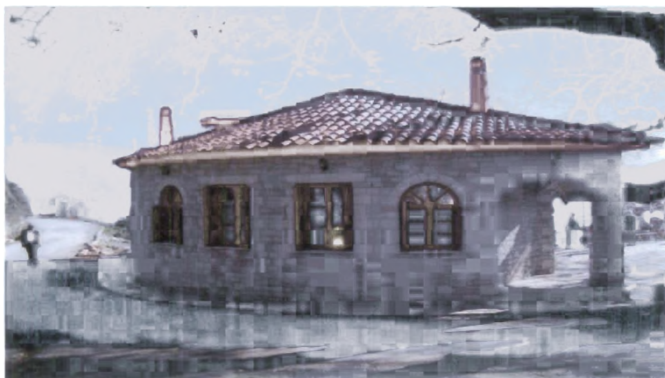
Λινίσταινα-Δήμος Ανδρίτσαινας: Παραδοσιακό καφενείο-ταβέρνα (Εξωτερικός χώρος)