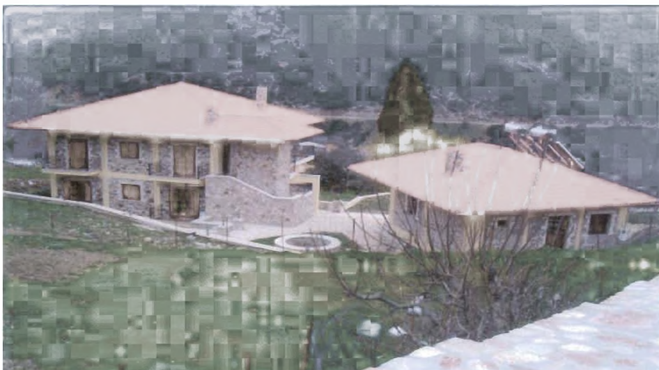
Λαμκεία (Δίβρη)-Δήμος Λαμκείας: Ενοικιαζόμενα επιπλωμένα διαμερίσματα