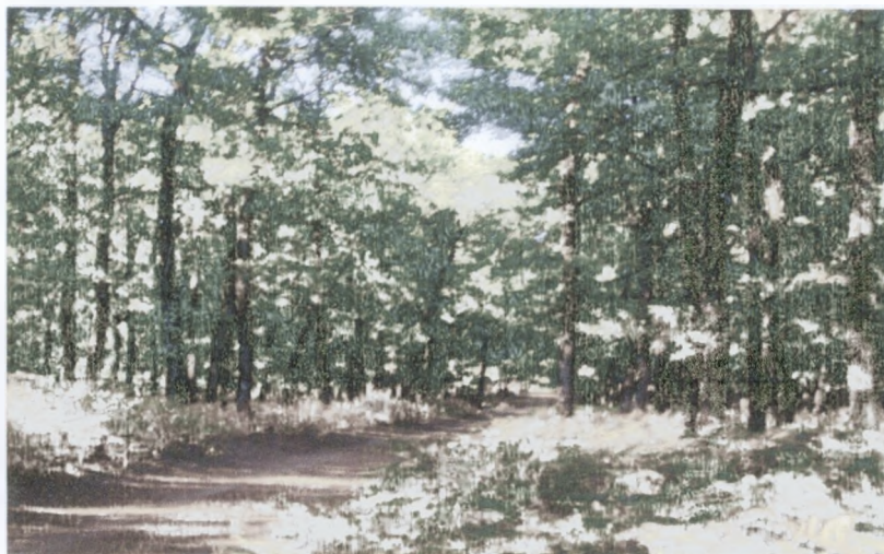
Το Δρυόδασος της Φολόης όπως ακριβώς είναι σήμερα.

Επίσης η Ηλεία έχει ποταμούς όπως ο Ερύμανθος , ο Αλφειός , ο ποταμός Νέδα όπου προσφέρονται για καγιάκ και rafting. Ο επισκέπτης αξίζει να επισκεφθεί το Φαράγγι της Νέδας όπου συναντάει καταρράκτες, φυσικά τούνελ, βλάστηση και την μοναδική φυσική ομορφιά του φαραγγιού, έναν από τους τελευταίους φυσικούς παραδείσους.