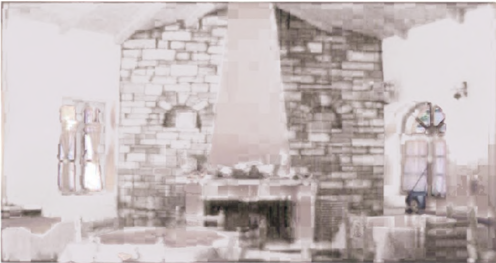
Λινίσταινα-Δήμος Ανδρίτσαινας: Παραδοσιακό καφενείο-ταβέρνα (εσωτερικός χώρος) και