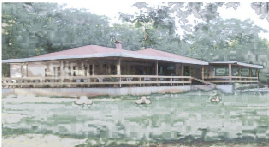
Κούμανι-Δήμος Φολόης: Αναψυκτήριο Κούμανι