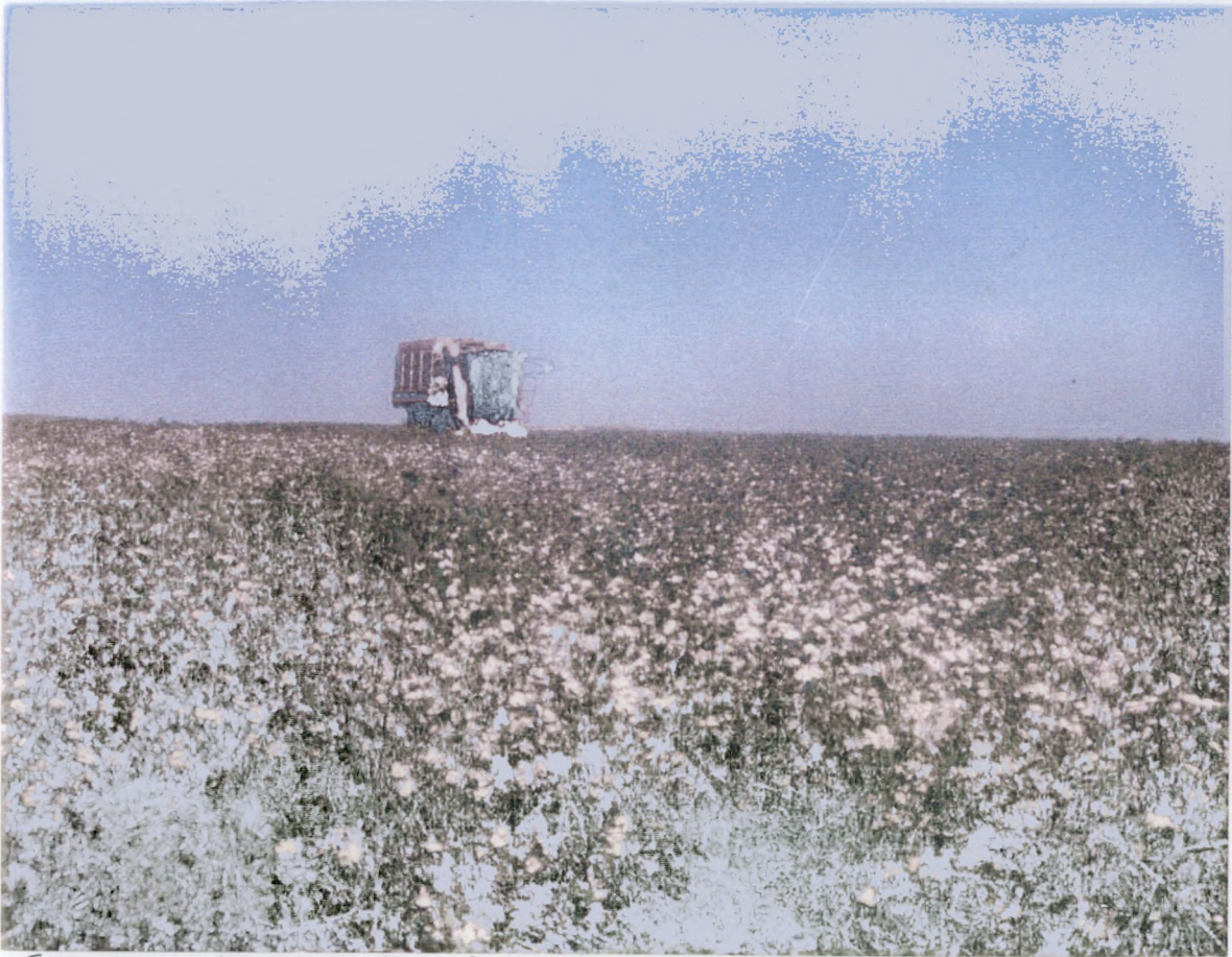
ΣΥΓΚΟΜΙΔΗ ΒΑΜΒΑΚΟΣ ΜΕ ΒΑΜΒΑΚΟΣΥΜΠΛΕΤΙΚΗ ΜΗΧΑΝΗ