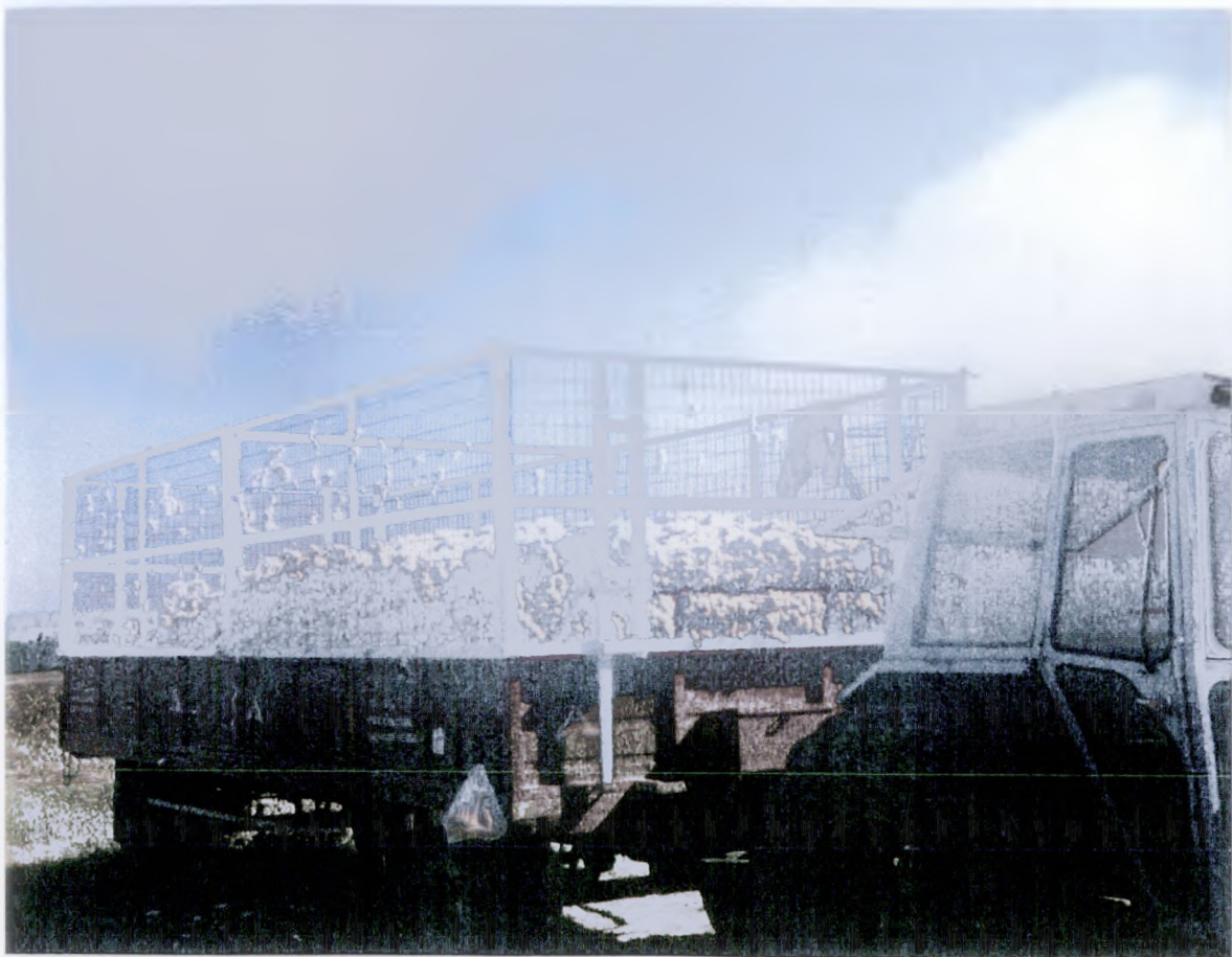
ΜΕΣΟ ΜΕΤΑΦΟΡΑΣ ΒΑΜΒΑΚΟΣ [ΠΛΑΤΦΟΡΜΑ]