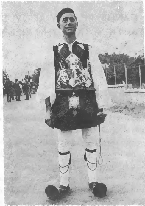
Εἰκ. 1. Ἡ ἐνδυμασία τῶν ἀρματωμένων.

Ὁ καταρτισμὸς τῶν ομάδων τούτων τῶν ἀρματωμένων λαμβάνει χώραν ἀμέσως μετὰ τὸ πέρας τῆς θείας λειτουργίας, τὴν πρωϊάν τῆς Πεντηκοστῆς. Κατὰ