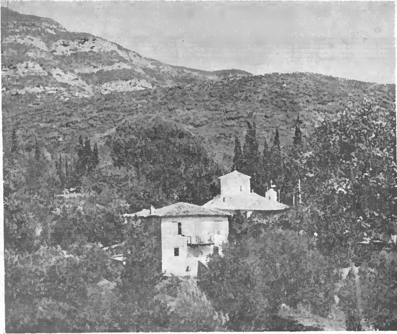
Εἰκ. 5. Ἡ μονὴ τοῦ Ἀγ. Συμεῶνος.

Μετὰ τὴν περάτωσιν τῆς συγκεντρώσεως ταύτης ἐγένετο ὑπὸ τοὺς ἤχους τῆς ζυγιάς, ἡ ὁποία ἐξετέλει εἰδικήν, ὡς κατωτέρω, μελωδίαν 1 , ἡ ἐκκίνησις ἐκ τοῦ σημείου τούτου πομπῆς, τῆς ὁποίας προηγεῖτο σημαιοφόρος ἔφιππος, εἶποντο δ' ἐπίσης ἔφιπποι, ἱερεὺς καὶ ὁ Δήμαρχος Μεσολογγίου, εἶτα δὲ οἱ ἔφιπποι πανηγυρισταί, οἱ ἀρματωμένοι καὶ ἄλλο πλῆθος. Ἡ πομπὴ αὕτη κατηθύνθη πρῶτον εἰς τὸ ἡρῶν τῆς πόλεως ὅπου ἐψάλη ἐπισημῶς ἐπιμνημόσυνος δέησις, ἐκεῖθεν δὲ κατόπιν ἤκο-