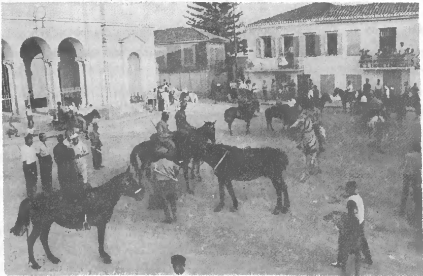
Εἰκ. 4. Συγκέντρωσις τῶν πανηγυριστῶν πρὸ τῆς ἐκκλησίας τοῦ Ἁγ. Σπυρίδωνος.