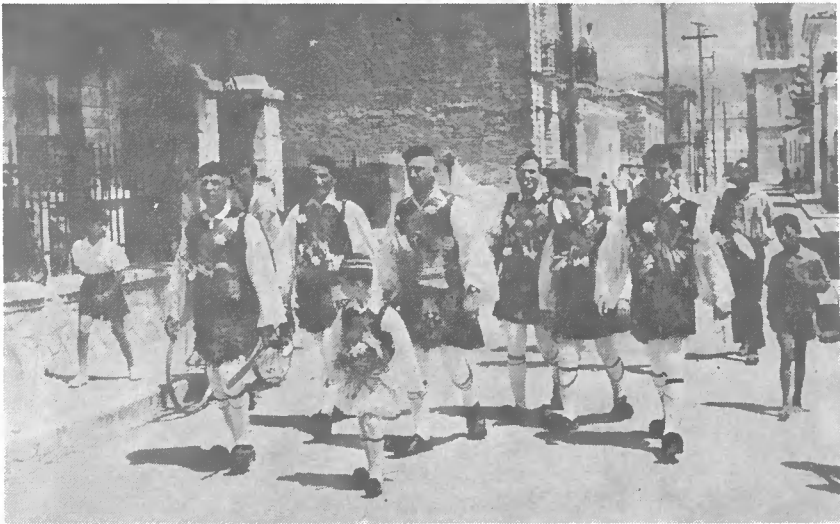
Εἰκ. 2. Ἡ παρέλασις ὁμάδος τῶν ἀρματομένων.

Ἡ ὁμάς (παρέγα), ἀφοῦ οὕτω συγκροτηθῆ, παρελαύνει εἰς τὰς ὁδοὺς τῆς πόλεως (εἰκ. 2), ἐπισκέπτεται τὰ «μαγαζιά» (=οὔζοπωλεῖα) ἔνθα προσφέρεται εἰς