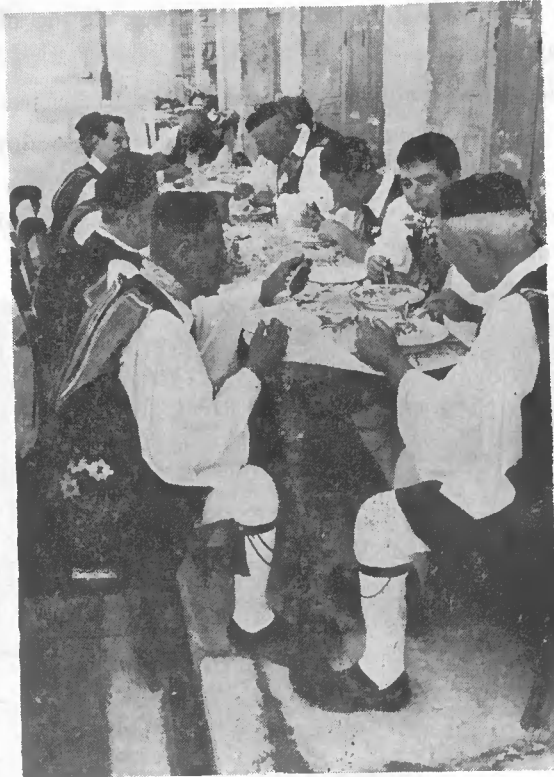
3. Ἡ συνεστίασις ομάδος τῶν ἀρματομένων.