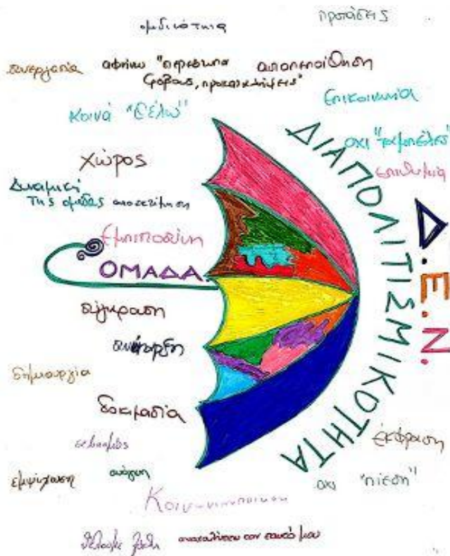
Εικόνα 2.1 Η διαπολιτισμικότητα στην εκπαίδευση