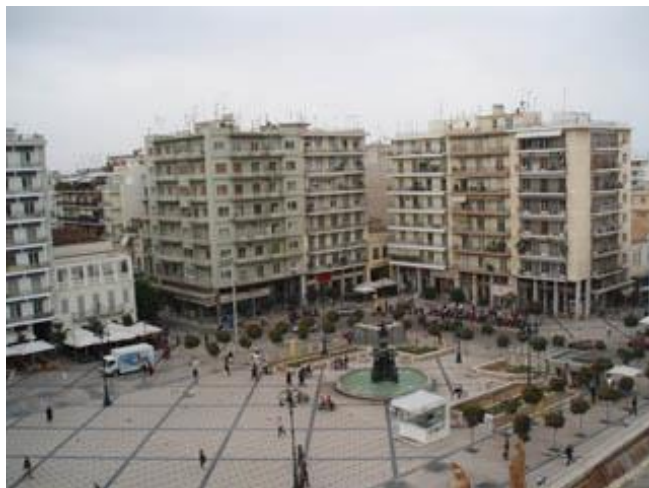
Εικόνα 16.Πλατεία Βασιλεύς Γεωργίου Α'