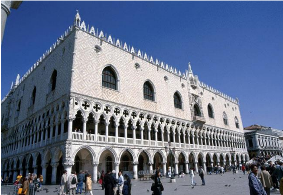
Εικόνα 6. Galleria dell' Accademia