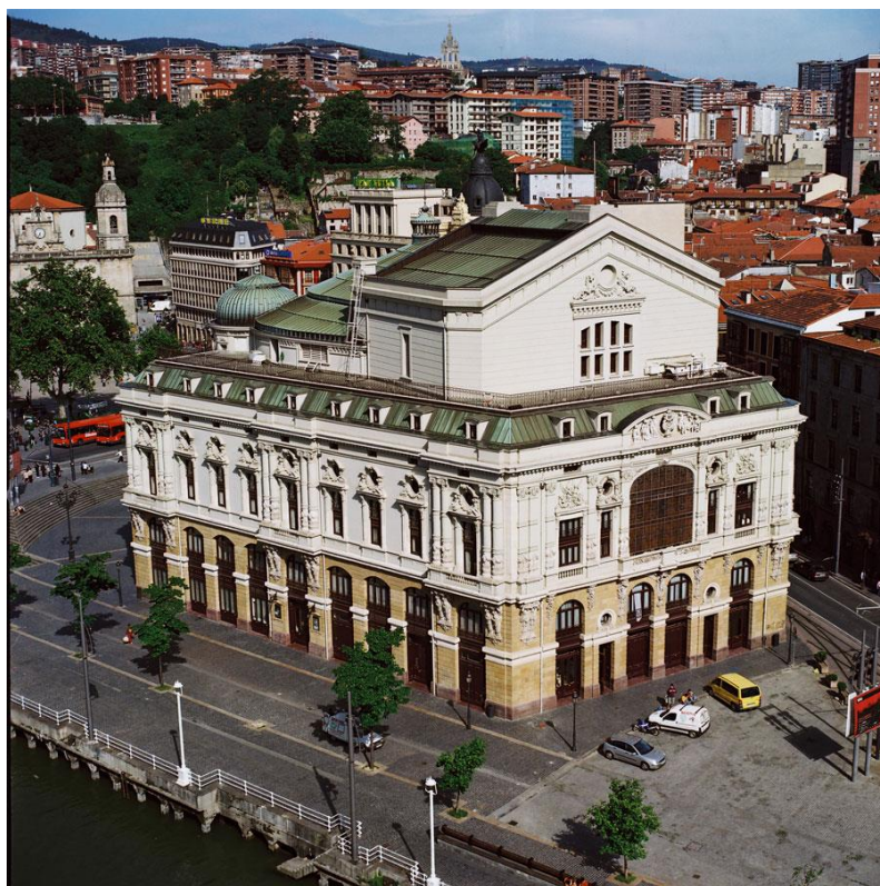
Εικόνα 3α & 3β. Θέατρο Αριάγκα

Ακόμα είναι χαρακτηριστικό της πόλης ότι κάθε είδους δημιουργοί διάσημοι ή όχι, χορευτές, καλλιτέχνες κάθε είδους από κάθε γωνιά του κόσμου, συναντώνται σε εκδηλώσεις στο Μπιλιμπάο, καθιστώντας το πόλο έλξης πολιτιστικού και καλλιτεχνικού ενδιαφέροντος προάγοντας το δημιουργικό δυναμικό της πόλης.