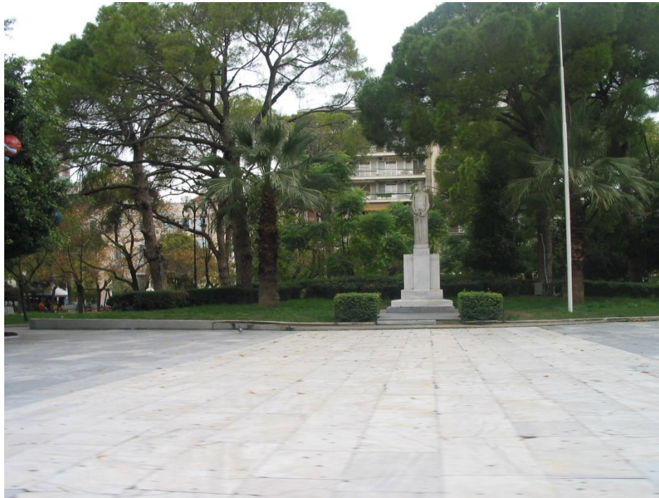
Εικόνα 15.. Πλατεία Όλγας

Ακόμα, έχει γίνει η σκέψη για ανάπλαση ενός μικρού τμήματος της παραλιακής ζώνης χωρίς όμως να υπάρχει κάποιος σχεδιασμός και προγραμματισμός σχετικά με το έργο αυτό. Πάρα ταύτα, η πόλη διαθέτει πάρκα, πλατείες και χώρους ψυχαγωγίας αξιόλογους όπως το δασύλλιο, η πλατεία Βασιλεύς Γεωργίου Α', η πλατεία Βασιλίσσης Όλγας και η πλατεία Αγίου Γεωργίου και η μαρίνα της πόλης και ο Φάρος.