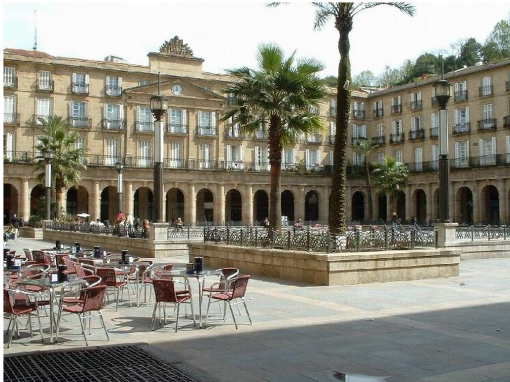
Εικόνα 13. Plaza Nueva-Bilbao