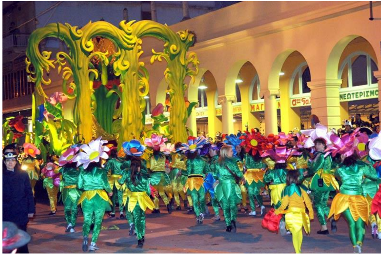
Εικόνα 5. Νυχτερινή παρέλαση