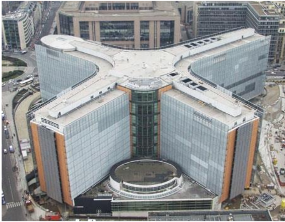
Εικόνα 3.Κτίριο Ευρωπαϊκής Επιτροπής, “Berlaymont”