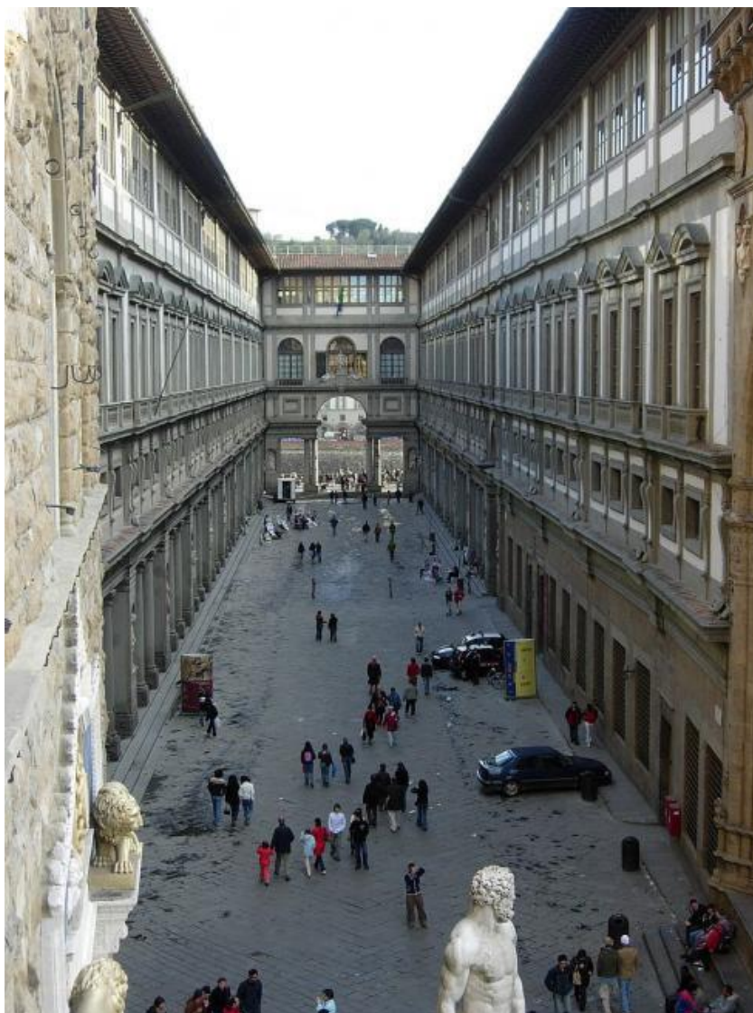
Εικόνα 5. Galleria Uffizi

αριθμός γκαλερί και εκθέσεων με σημαντικότερες αυτών την “Galleria dell' Accademia” και την “Galleria Uffizi”. Όσον αφορά τα μουσεία της πόλης, αυτό που ξεχωρίζει είναι το Μουσείο Μπαρτζέλο “Museo del Bargello”.