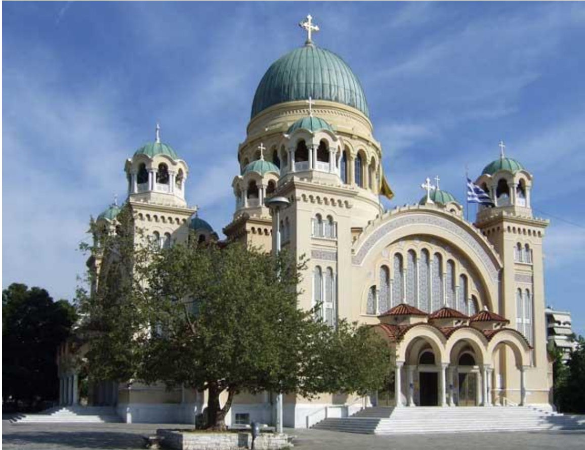
Εικόνα 10. Νέος Ιερός Ναός Αγίου Ανδρέα, 1974

Εκτός από τα παραπάνω αρχιτεκτονικά οικοδομήματα, στην Πάτρα συναντάμε μνημεία της ελληνικής ορθοδοξίας όπως βυζαντινές και μεταβυζαντινές εκκλησίες αλλά και ναούς με σπάνια εικαστικά δημιουργήματα όπως τοιχογραφίες, εικόνες και ψηφιδωτά.