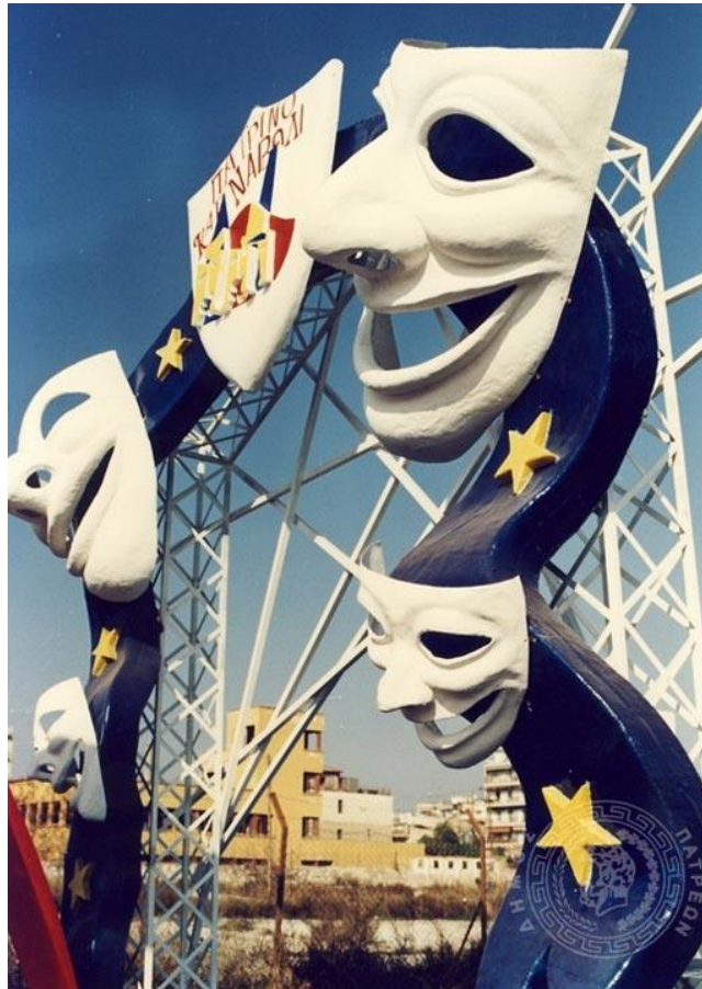
Εικόνα 4α. Άρμα καρναβαλιού

Τέλος, το Διεθνές Φεστιβάλ Πάτρας μπορούμε να πούμε ότι αποτελεί τόπο διεξαγωγής κορυφαίων πολιτιστικών γεγονότων με πρωτότυπες παραγωγές καθιστώντας το χωνευτήρι ιδεών και επικοινωνητικού διαλόγου.