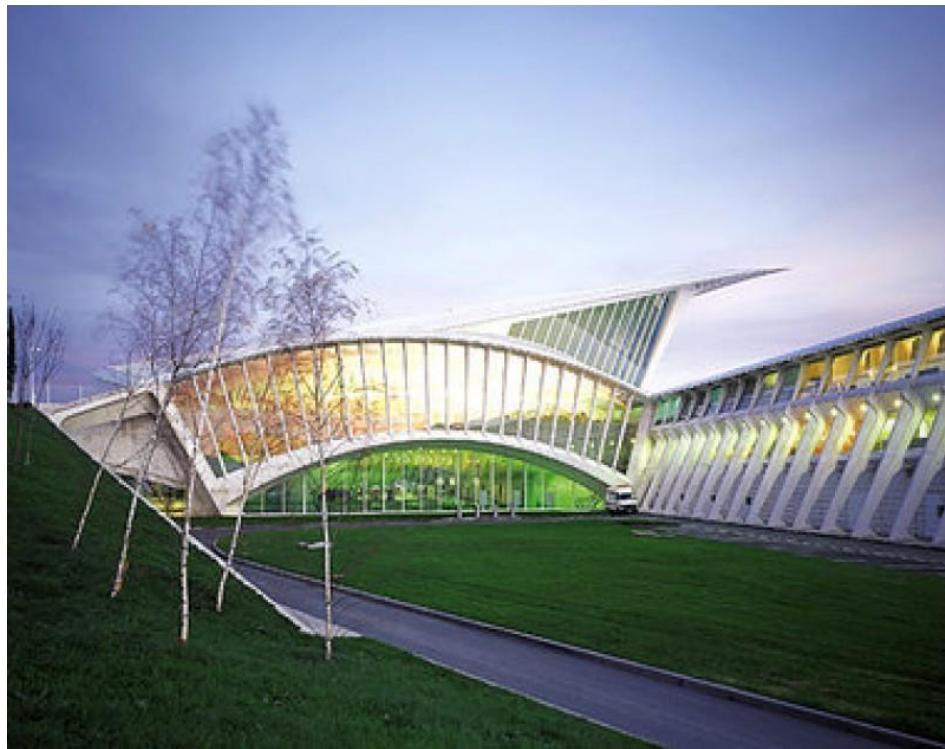
Εικόνα 10.. Αεροδρόμιο Παλόμα-Μπιλιμπάο

Έτσι δημιουργήθηκαν σημαντικά έργα υποδομής όπως γέφυρες (εικ.8), το μετρό, το τράμ και τις σιδηροδρομικές γραμμές γενικότερα, το αεροδρόμιο Παλόμα, πάρκα αλλά και αναβαθμίστηκαν υπάρχοντα κτίρια όπως θέατρα(εικ. 3 &4), πάρκα και πλατείες.