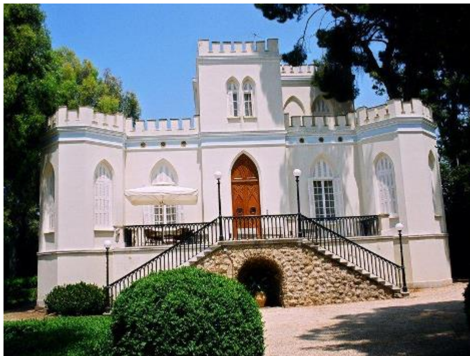
Εικόνα 9.17 Αρχοντικό Γεωκήμονα της περιοχής των Πατρων, 1909