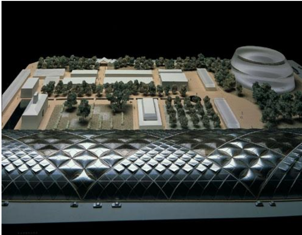
Εικόνα 9.Μακέτα σταθμού τρένων υψηλής ταχύτητας SAV, Sir Norman Foster-studio Ove Arup Engineering

της πόλης, για το σταθμό τρένων υψηλής ταχύτητας SAV και για την ανάπτυξη του αεροδρομίου της Φλωρεντίας που αποτελούν τις εισόδους της πόλης όπου εάν πραγματοποιηθούν θα αποτελέσουν καινοτομία στον χώρο της σύγχρονης αρχιτεκτονικής.