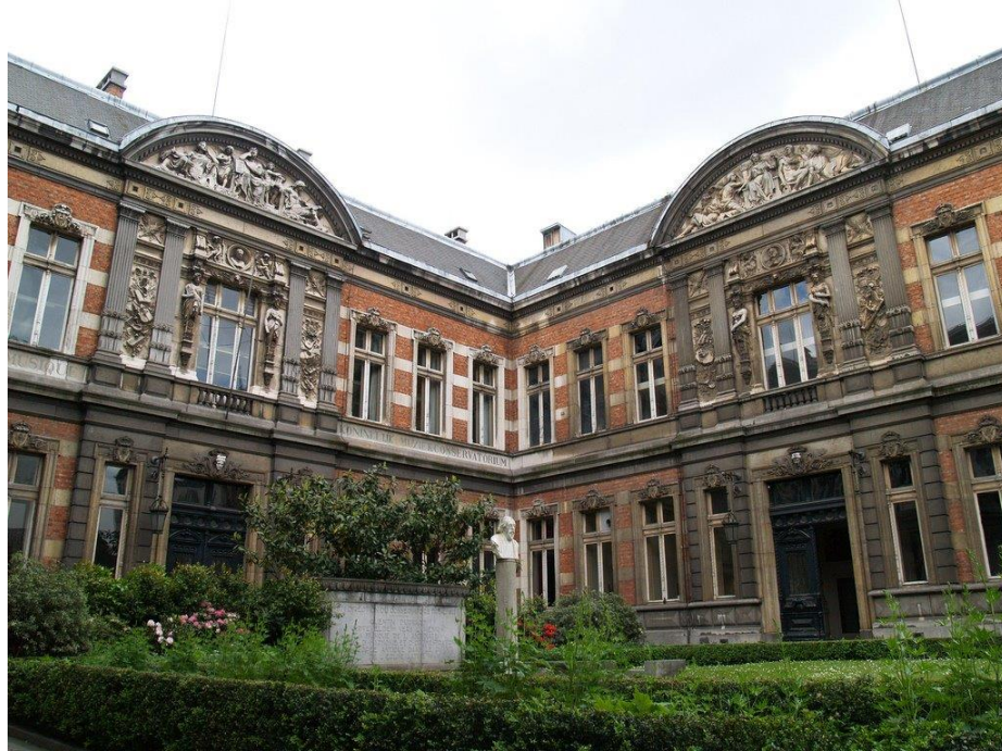
Εικόνα 2. Βασιλικό Ωδείο

Καταλυτής στην καλλιτεχνική ζωή της πόλης αποτελεί το Βασιλικό Ωδείο όπου στεγάζεται η δραματική και η μουσική ακαδημία έχοντας να παρουσιάσει σημαντικό έργο σε όλους τους τομείς ενώ αποτελεί και την μακρά μουσική παράδοση της πόλης.