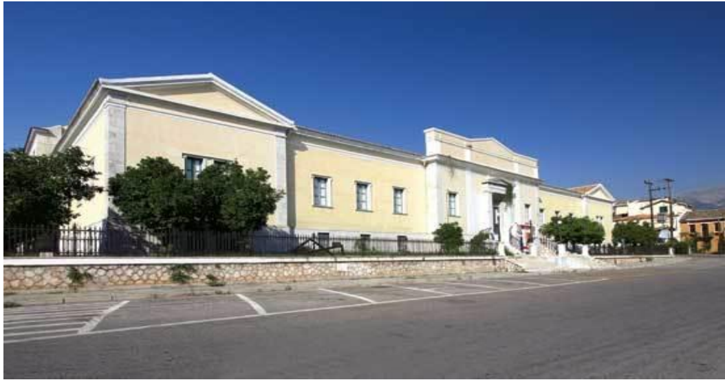
Εικόνα 1..Παλιό Δημοτικό Νοσοκομείο