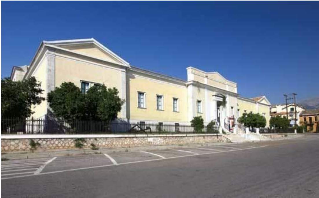
Εικόνα7..Νεοκλασικό κτίριο του Δανού αρχιτέκτονα CH. E. Hansen 1872

Ο πλούτος που συγκεντρώθηκε στην Πάτρα κατά την μεταπολεμική περίοδο με την εκβιομηχάνισή της αλλά και πολύ πριν, κατά την περίοδο της προσάρτησης της στο Ελληνικό κράτος όπου ανθούσε ο εμπορικός τομέας, δικαιολογεί την ύπαρξη των περίτεχνων και ιδιαίτερης αρχιτεκτονικής νεοκλασικά κτίρια στο ιστορικό κέντρο της πόλης.