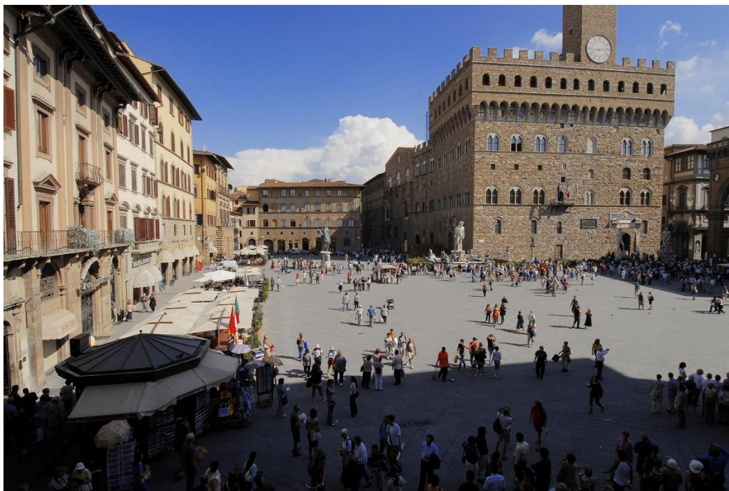
Εικόνα 14 Η Piazza della Signoria