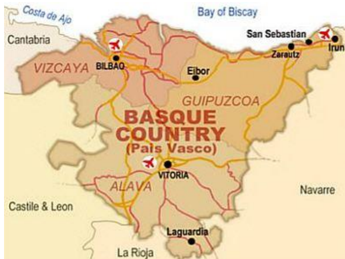
Εικόνα 1. χάρτης Βισκαϊκής χώρας

Η πόλη του Μπιλμπάο βρίσκεται στην Ισπανία και είναι η πρωτεύουσα της επαρχίας της Βισκαϊκής, στη Χώρα των Βάσκων. Η πόλη περιτοιχίζεται από λόφους και βρίσκεται σε απόσταση 11 χιλιομέτρων από τον Ατλαντικό Ωκεανό, με τον οποίο και συνδέεται μέσω του πλωτού ποταμού Nervion. Σε αυτό το ποτάμι το Μπιλμπάο οφείλει το όνομά του (από το bi albo, που στα βασκικά σημαίνει «δύο όχθες») και την παλιά του αίγλη.