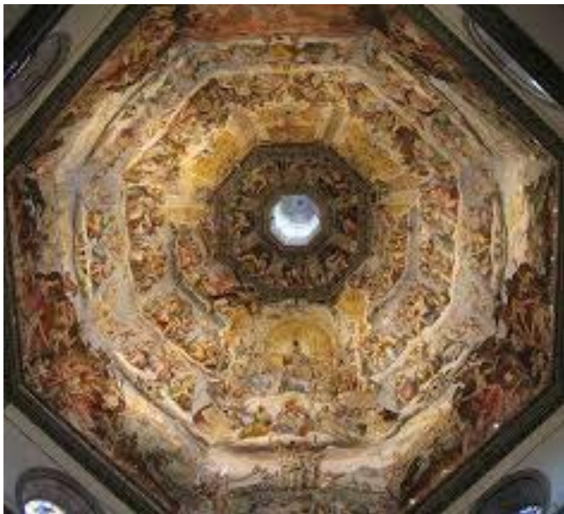
Εικόνα 2.. Τρούλος του καθεδρικού ναού του Φιλίππο Μπρουνελλέσκι