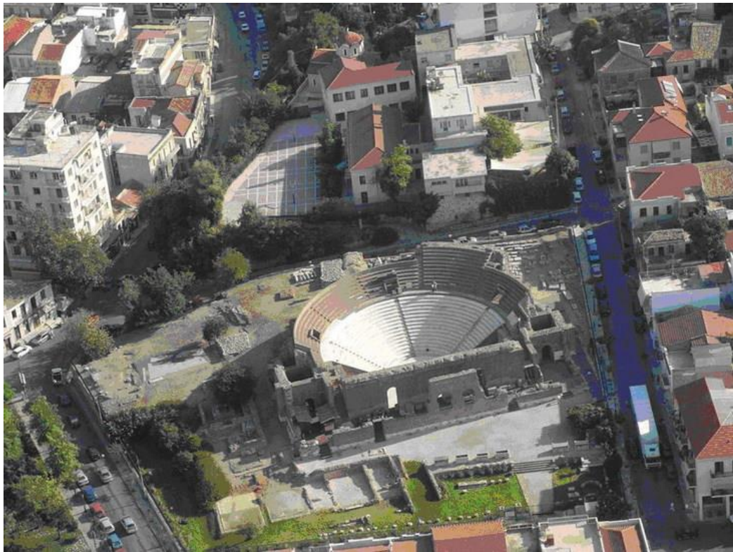
Εικόνα 2. το Ρωμαϊκό Ωδείο