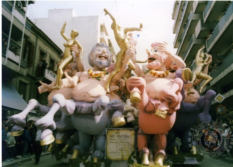
Εικόνα 4β. Άρμα καρναβαλιού