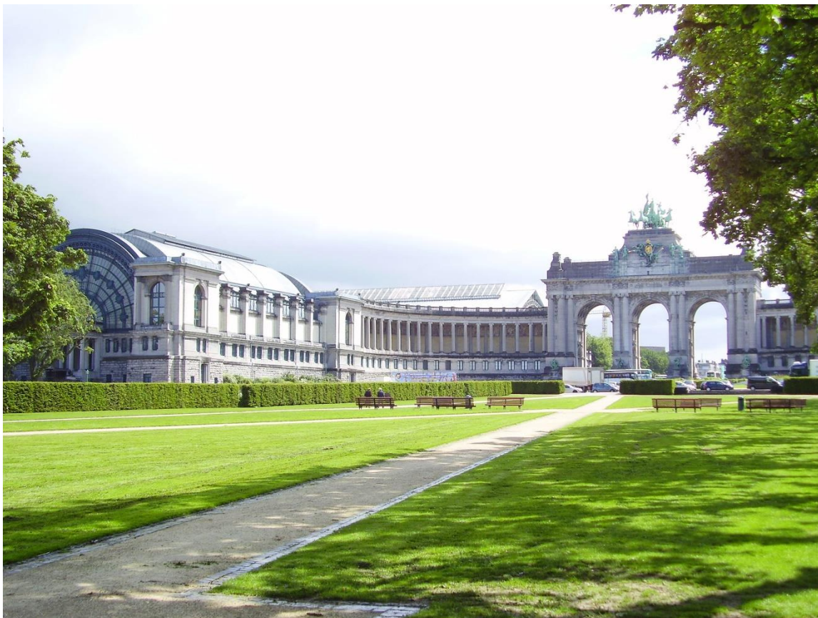
Εικόνα 7. Πάρκο Cinquantenaire