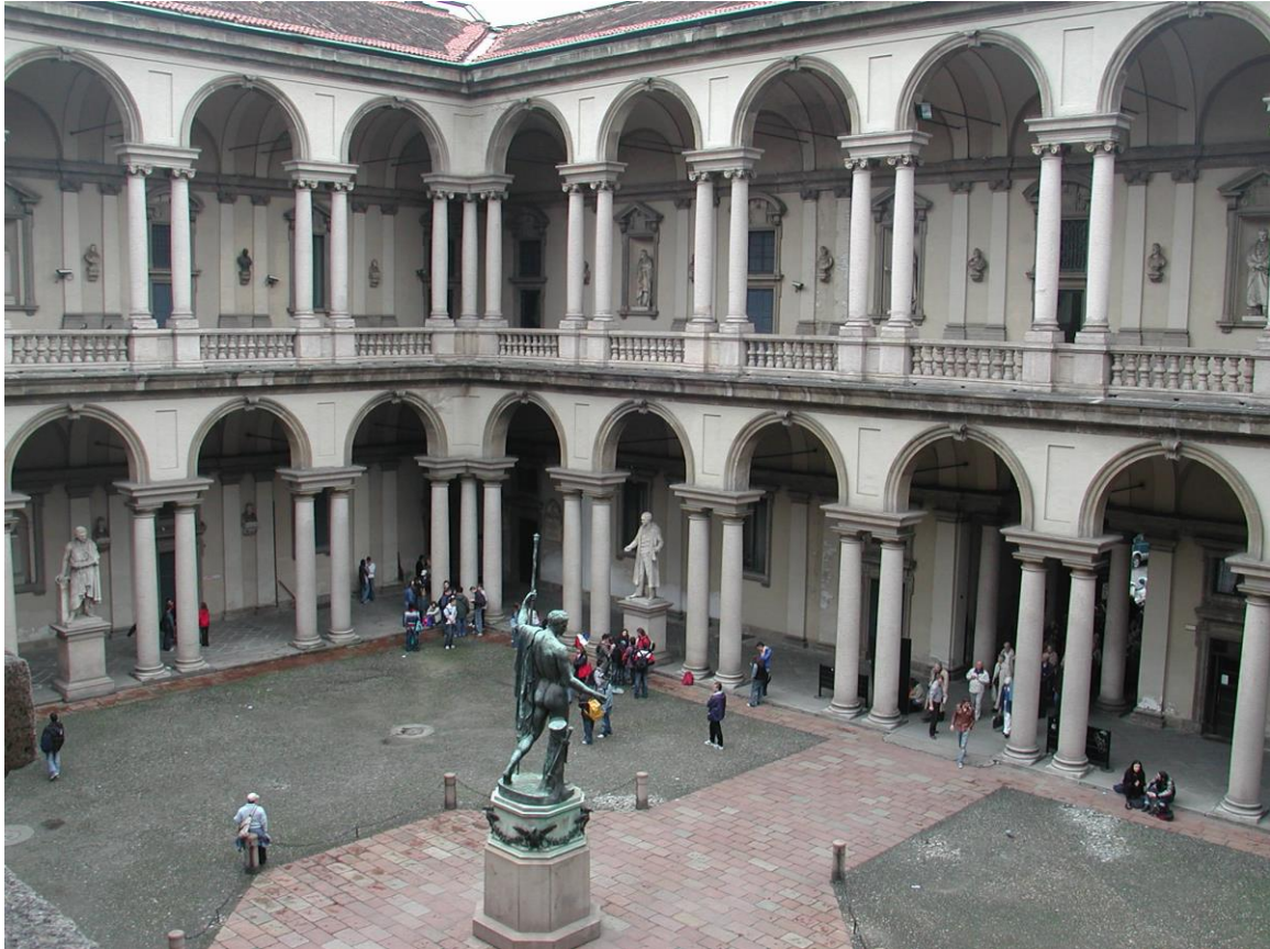
Εικόνα 8 Ακαδημία Καλών Τεχνών “Accademia delle Belle Arti”

Εκτός όμως των παραπάνω, η πόλη προσανατολίζεται στην ανάδειξη και στην δημιουργία νέων καλλιτεχνών μέσα από τις σχολές καλών τεχνών που διαθέτει με σημαντικότερη αυτών, την Ακαδημία Καλών Τεχνών “Accademia delle Belle Arti”. Αυτό όμως που είναι πραγματικά αξιοσημείωτο, είναι ο τρόπος που εντάσσει στο δυναμικό της, τους νέους καλλιτέχνες διαμέσου των ευκαιριών που προσφέρει για εκθέσεις και εργασία σε διάφορα εργαστήρια. Αυτό έχει ως αποτέλεσμα, η πόλη, εκτός του να παράγει καλλιτέχνες να δύναται να τους κρατήσει εκεί αναβαθμίζοντας το δυναμικό της και την αξία των πολιτιστικών προϊόντων της.