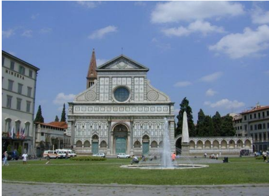
Εικόνα 13 Πλατεία Αγίας Μαρίας "Piazza of Santa Maria Novella"