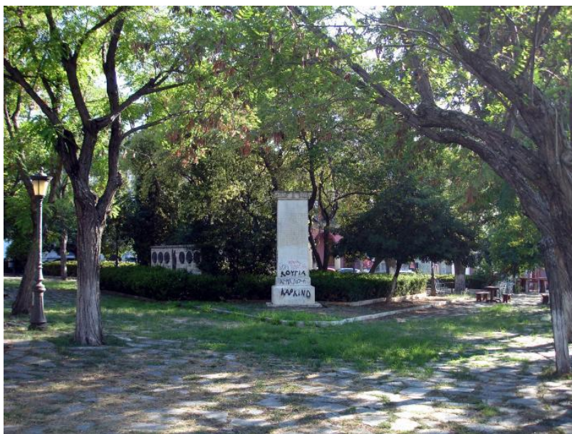
Εικόνα 16.Πλατεία Αγίου Γεωργίου