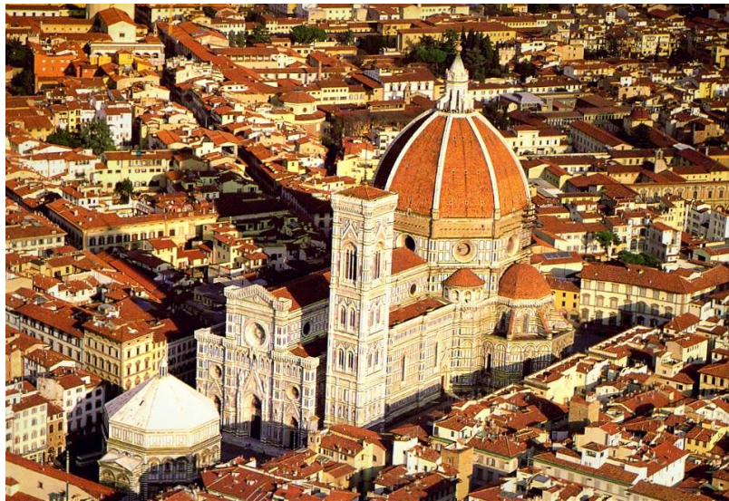
Εικόνα 1. Καθεδρικός Ναός της Φλωρεντίας “Santa Maria del Fiore”

Αιχμή του δόρατος της πόλης αποτέλεσαν και αποτελούν οι τέχνες με οποιαδήποτε μορφή μπορούμε να την συναντήσουμε. Σημαντικοί καλλιτέχνες παγκοσμίου βεληνεκούς έζησαν και δημιούργησαν μοναδικά έργα ανεκτίμητης αξίας όπως ο Μιχαήλ Άγγελος με έργα εξωτερικής διακόσμησης κτιρίων, ο Φιλίππο Μπρουνελλέσκι με έργα όπως ο τρούλος του καθεδρικού ναού, τον Λορέντσο Γκιμπέρτι, τον Ντονατέλλο και πάρα πολλούς άλλους ισάξιους καλλιτέχνες. Η ζωγραφική, η γλυπτική, η αρχιτεκτονική, η ποίηση και η λογοτεχνία, η μουσική και το θέατρο ήταν οι τέχνες που ανθούσαν αλλά και οι επιστήμες με σημαντικότερο εκπρόσωπο τους τον Λεονάρντο Νταβίντσι. Δεν είναι τυχαίο άλλωστε ότι την αποκαλούν και «πρωτεύουσα της τέχνης». Μάλιστα, το ιστορικό κέντρο της πόλης προστατεύεται από την UNESCO καθώς θεωρείται μνημείο παγκόσμιας κληρονομιάς.