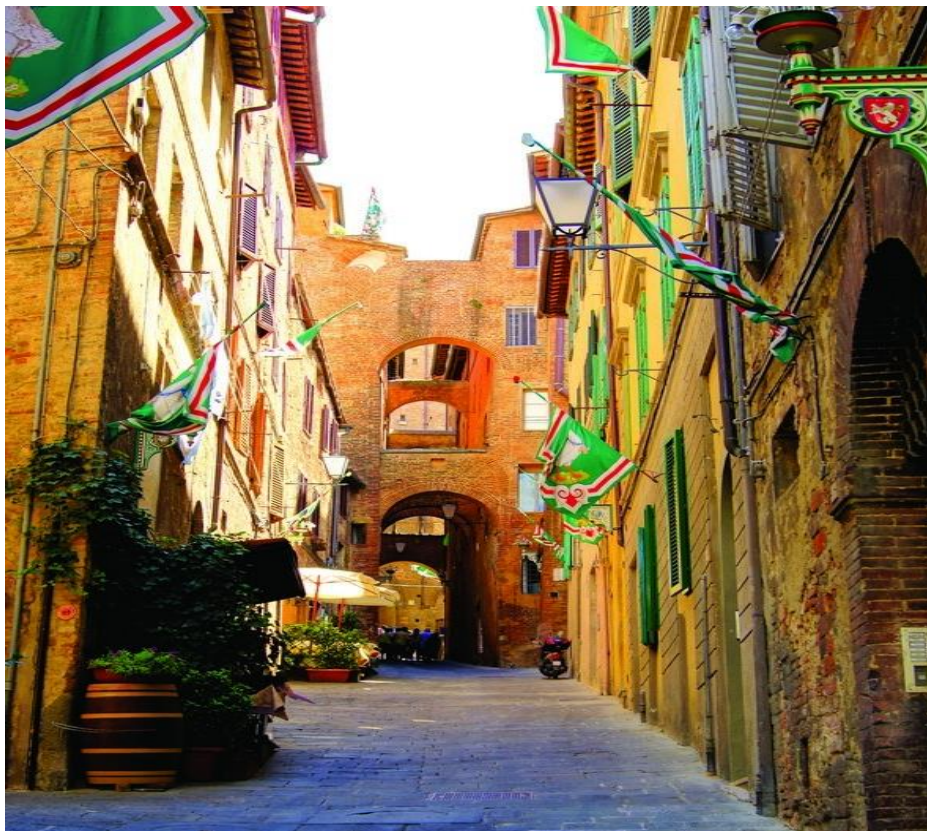
Εικόνα 11 τυπικός πεζόδρομος πόλης

Επιπλέον, η υπάρχουσα πεζοδρόμηση λειτούργησε προς όφελος της πόλης αφού σε συνδυασμό με τα υφιστάμενα κτίρια γοθτικής αρχιτεκτονικής και τα φεστιβάλ που λαμβάνουν χώρα δημιουργούν σκηνικά υπαίθριων εκθέσεων και μουσικών, θεατρικών σκηνών, ειδικότερα το καλοκαίρι, με αποτέλεσμα ο περαστικός να νιώθει μοναδικό κομμάτι της πόλης.