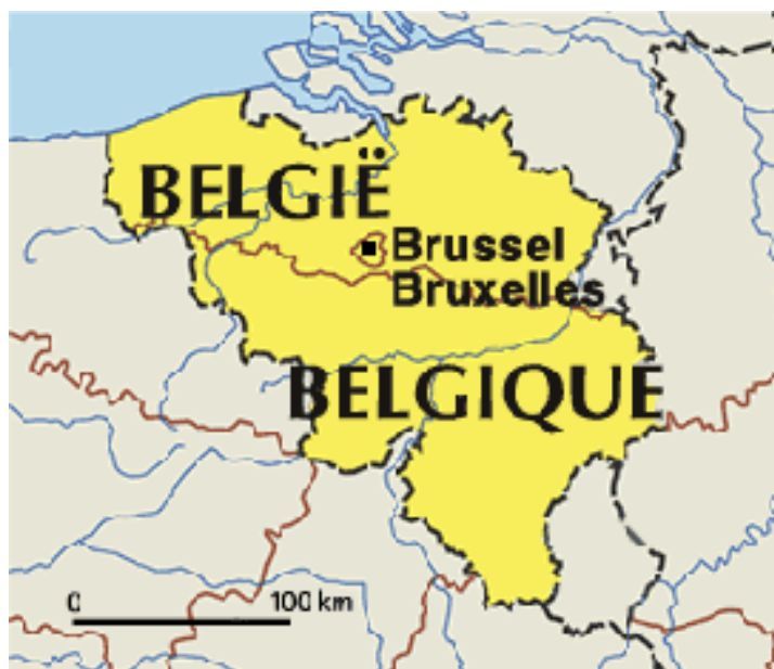
Εικόνα 1. Χάρτης Βελγίου