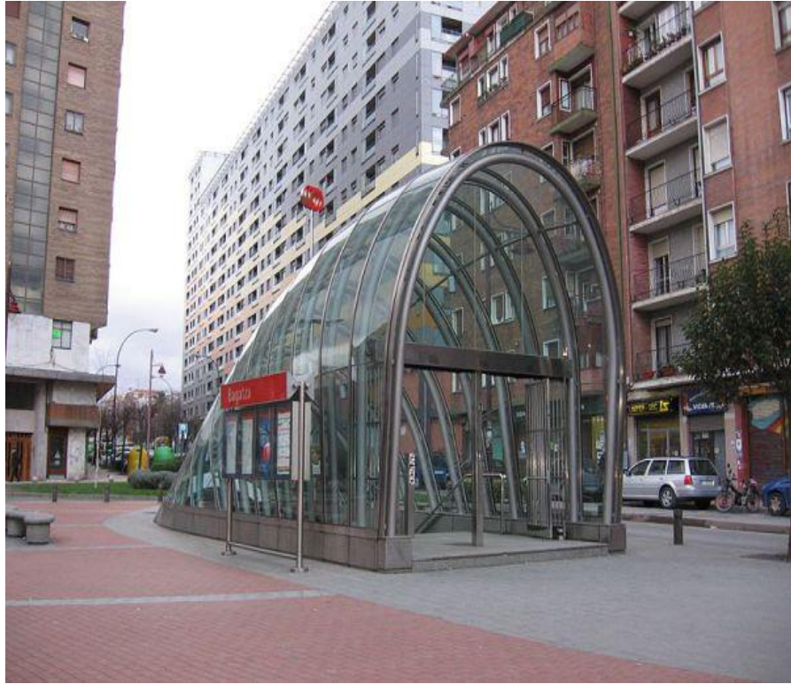
Εικόνα 11. Είσοδος του Μετρό-Μπιλμπάο