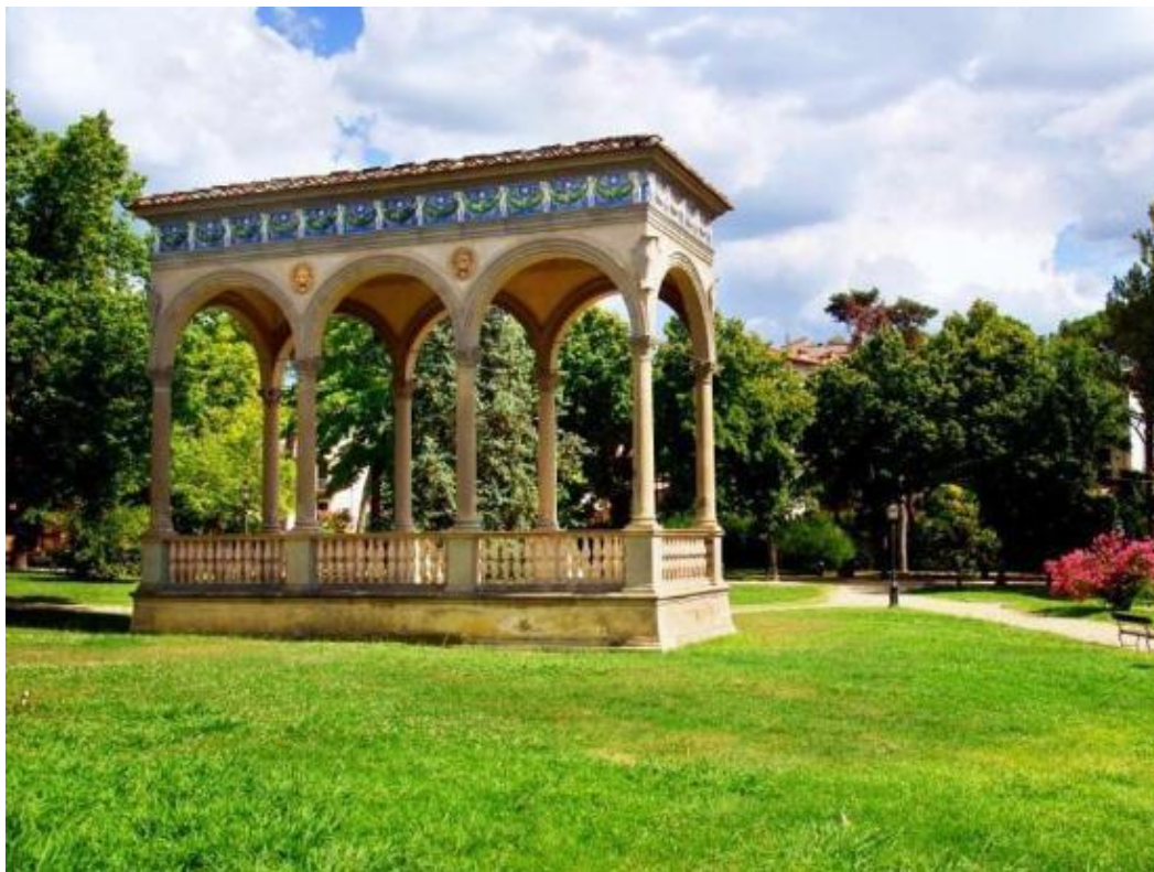
Εικόνα 15 Giardino dell'ArteCultura