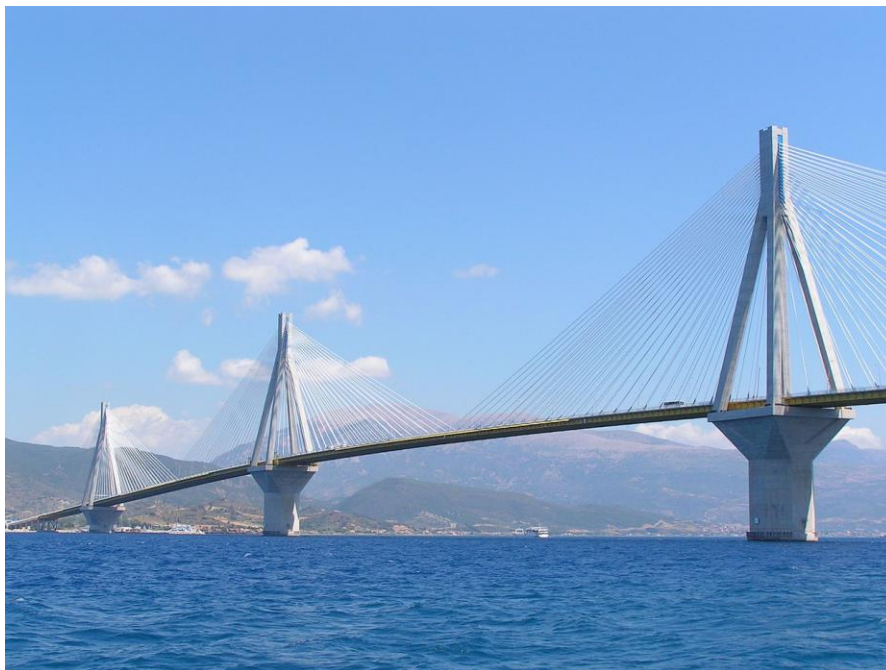
Εικόνα 11..Γέφυρα Χαρίλαος Τρικούπης