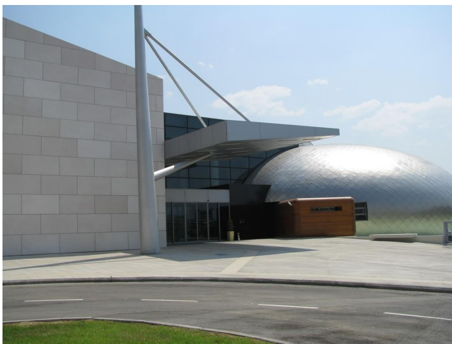
Εικόνα 12.Αρχαιολογικό Μουσείο

Στην πόλη όμως τα τελευταία χρόνια παρατηρείται μια έντονη κινητικότητα σχετικά με τον τομέα των δημιουργικών τεχνών καθώς εκτός από το πανεπιστημιακό ίδρυμα της πόλης που έχει επιδείξει σημαντικό έργο στον τομέα αυτό και ιδιαίτερα στην αρχιτεκτονική υπάρχουν και αρκετές σχολές καλών τεχνών στην πόλη.