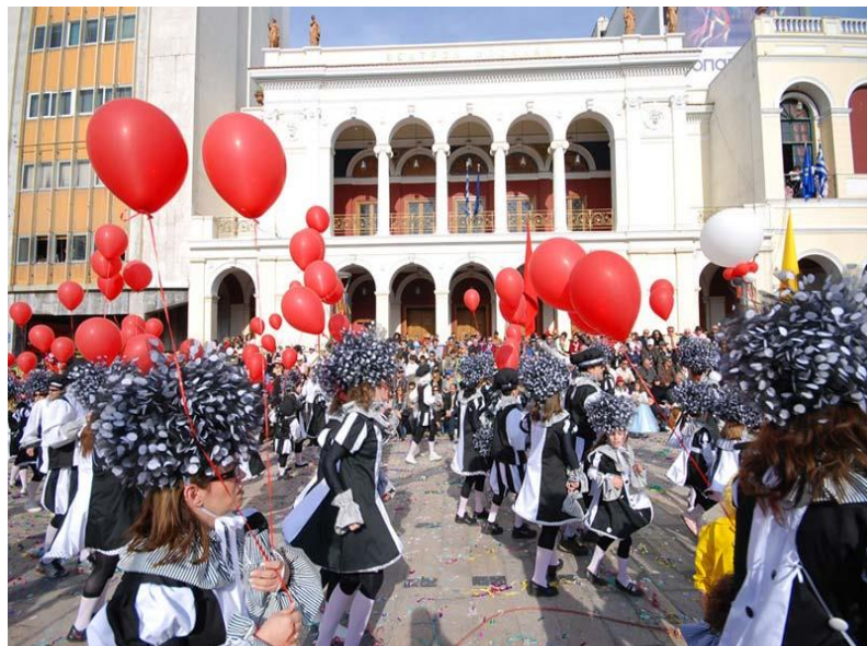
Εικόνα 616α. Μεγάλη παρέλαση