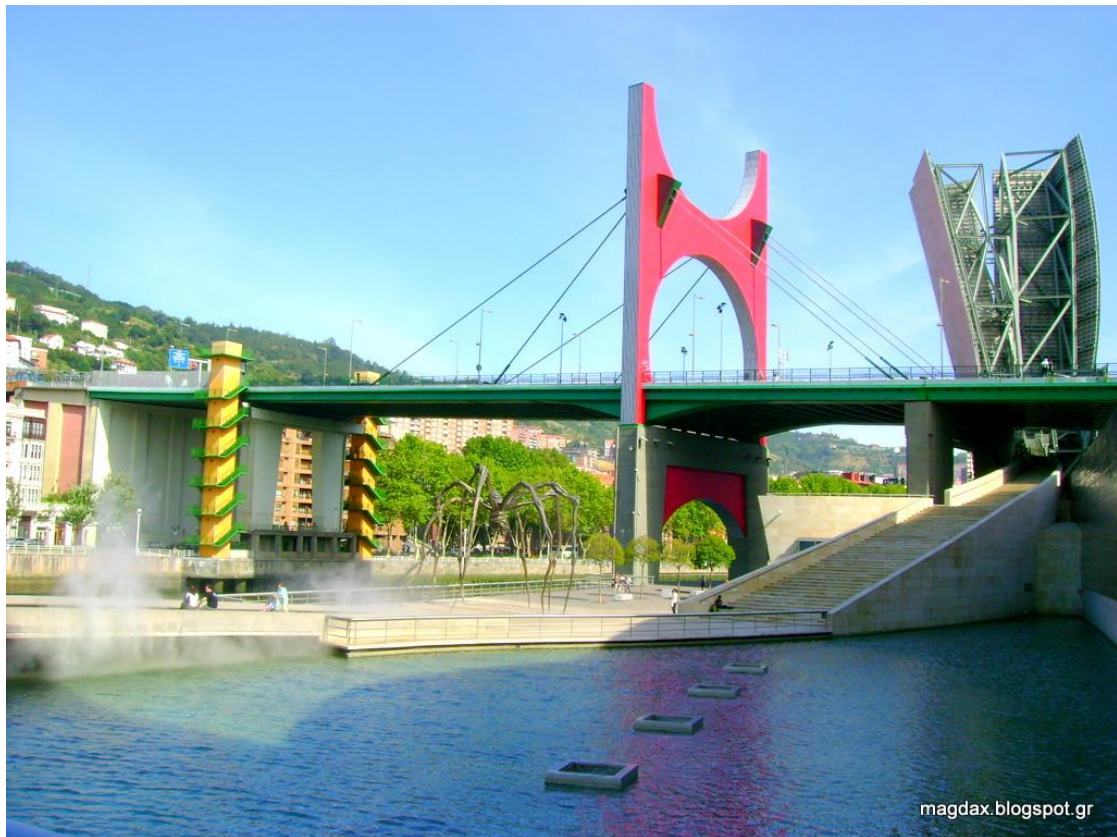
Εικόνα 8. Γέφυρα La Salve Bridge