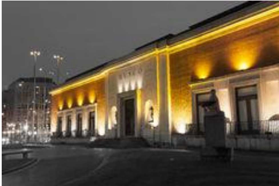
Εικόνα 7. Μουσείο Καλών Τεχνών