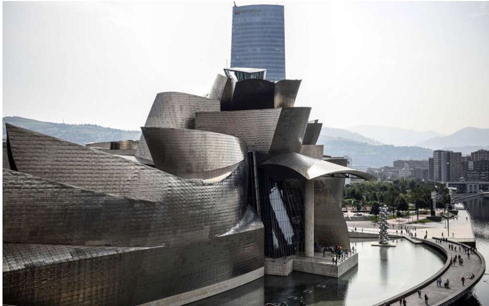
Εικόνα 5. Μουσείο Γκούγκενχάιμ