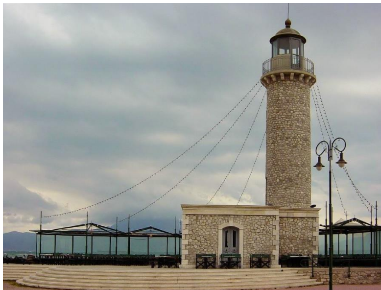
Εικόνα 17.19 Φάρος Πατρών

Η ελπίδα της πόλης όμως φέρεται να είναι η βιομηχανία της πόλης, παρά τον στραγγαλισμό που υφίσταται λόγω της οικονομικής ασφυξίας και ορισμένων έργων υποδομής που λείπουν από την πόλη, όπου σε συνεργασία με τα εκπαιδευτικά ιδρύματα της πόλης μπορούν παράγουν καινοτόμα προϊόντα και υπηρεσίες με αποτέλεσμα πλούτο για την πόλη.