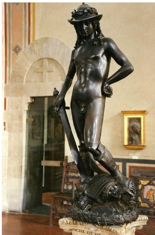
Εικόνα 4. ο Δαβίδ του Ντονατέλλο, Μουσείο Μπαρτζέλλο της Φλωρεντίας

Για τον λόγο αυτό, η πόλη εκμεταλλεύεται το χαρακτηριστικό της αυτό γνώρισμα και την πλουσιότατη πολιτισμική και πολιτιστική της κληρονομιά επενδύοντας σε υπηρεσίες που αναδεικνύουν τον τουρισμό και την πολιτιστική βιομηχανία.