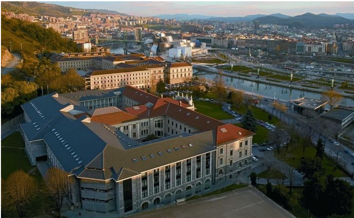
Εικόνα 9. Πανεπιστημιακή Βιβλιοθήκη του Deusto

Όπως είναι αντιληπτό, η δημιουργική και θετική δυναμική του σύγχρονου Μπιλμπάο, αναδεικνύεται με την έκθεση έργων από αρχιτέκτονες και δημιουργικές ομάδες της πόλης σε κάθε σημείο της, αφού ολόκληρη η πόλη αποτελεί ένα ανοιχτό μουσείο σύγχρονης αρχιτεκτονικής. Η τέχνη, οι ιδέες, το πνεύμα, ο πολιτισμός έχουν βρει στο Μπιλμπάο τον τρόπο να αλληλοτροφοδοτούνται, να συνυπάρχουν και να εξελίσσονται ενώ η πόλη εστιάζει πλέον σε νέες στρατηγικές σχεδιασμού σε συνάρτηση με τις εξελίξεις που λαμβάνουν χώρα στην πόλη, με αποτέλεσμα οι δημιουργικές ομάδες της πόλης, της τοπικής αστικής παράδοσης και των μετασχηματισμών του δημόσιου χώρου να δίνουν ιδιαίτερο χαρακτήρα στην πόλη όπου έχει ως στόχο την μελλοντική οικονομική ανάπτυξη της και την ανάπτυξη του πληθυσμού της.