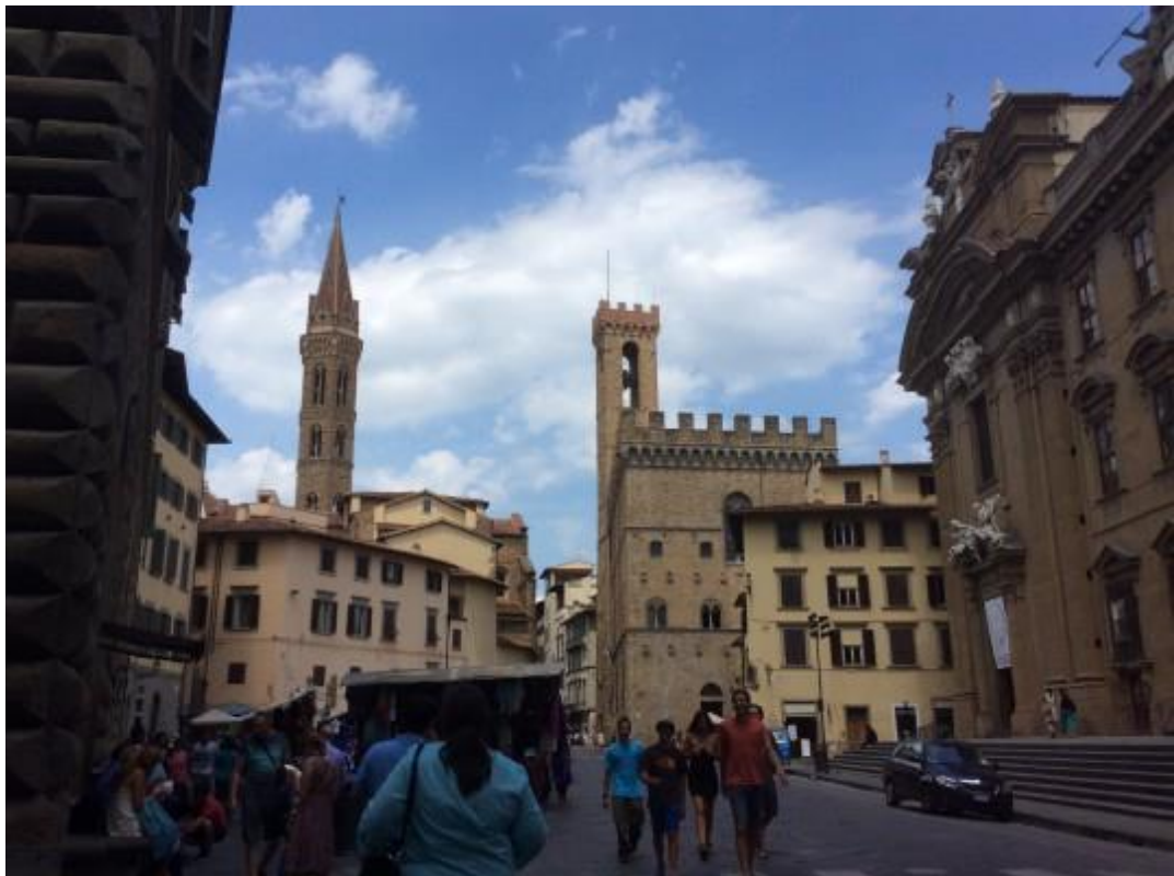
Εικόνα 7. Μουσείο Μπαρτζέλο "Museo del Bargello"