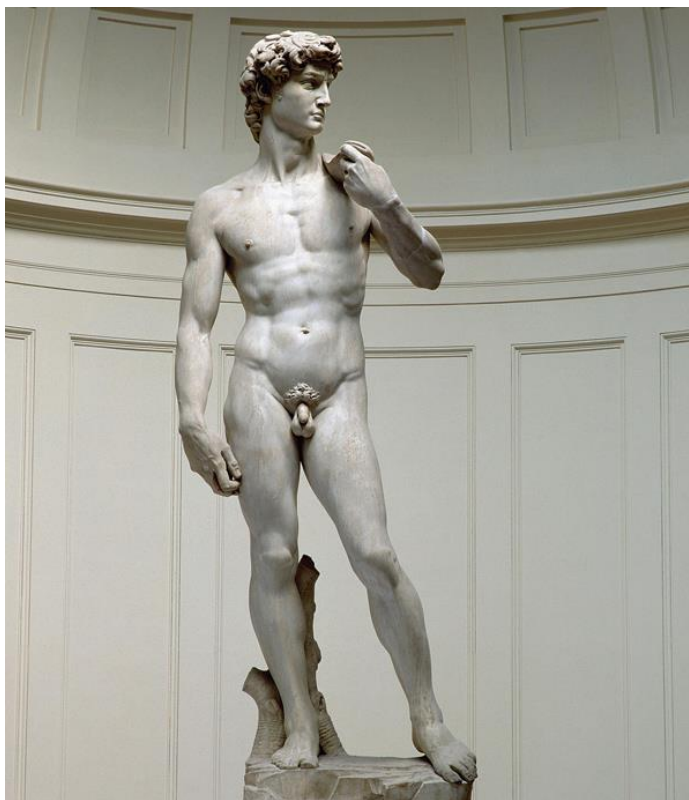
Εικόνα 3.Δαβίδ του Μιχαήλ Αγγέλου