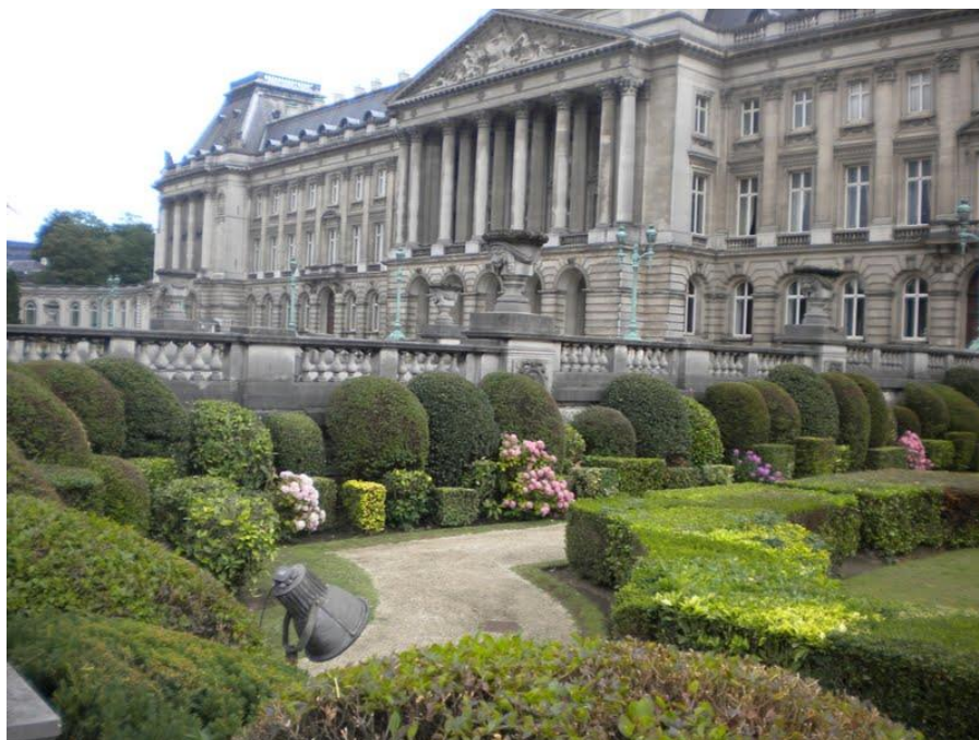
Εικόνα 5.Βασιλικό παλάτι των Βρυξελλών

Λαμβάνοντας υπόψιν το πλήθος των εκθέσεων που οργανώνονται με θέμα την αρχιτεκτονική, την μόδα, την αρχιτεκτονική τοπίου καθώς επίσης και την παραγωγή σχεδίων για βιομηχανική χρήση και όχι μόνο, γεγονός που μαρτυράτε από τις επιχειρήσεις παροχής υπηρεσιών που είναι εγκατεστημένες στην περιοχή των Βρυξελλών, αλλά και οι έρευνες σε καινοτομίες των πανεπιστημίων της περιοχής είναι αντιληπτό το μέγεθος και η εξέλιξη που βιώνει η πόλη στους τομείς αυτούς. Χαρακτηριστικές είναι οι εκθέσεις που διοργανώνονται “Brussels Biennale of Modern Architecture” και “Biennale Art Nouveau & Art Deco”