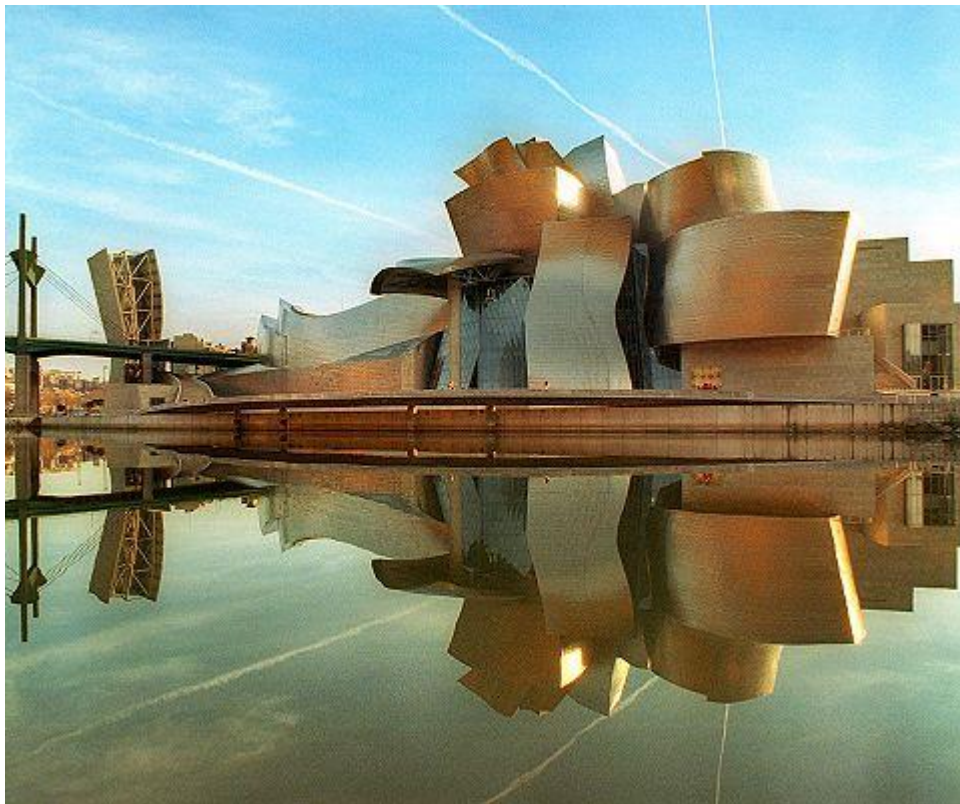
Εικόνα 6. Μουσείο Γκούγκενχάιμ