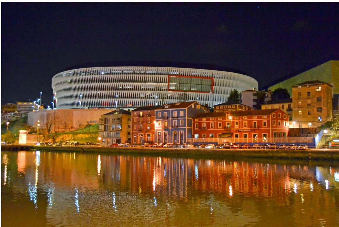
Εικόνα 4.Στάδιο ΣΑΝ ΜΑΜΕΣ - Μπιλμπάο