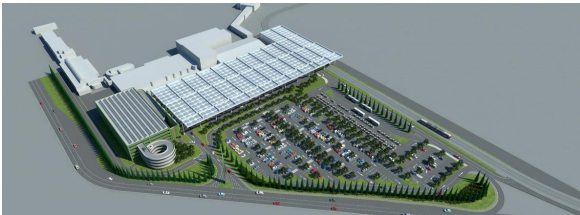
Εικόνα 10Μακέτα ανάπτυξης αεροδρομίου,Pascall+Watson Ltd

Ακόμα φιλοξενεί κάθε χρόνο πέντε γεγονότα μόδας με διεθνή εμβέλεια τα οποία είναι το Pitti Immagine Uomo, το Bimbo, το FILATI, το Casa και το ModaPelle αλλά και εκθέσεις μόδας.