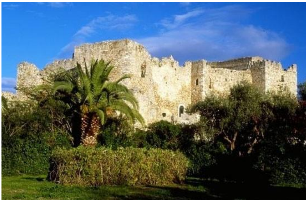
Εικόνα 3.το Κάστρο της πόλης

Θα μπορούσαμε να πούμε ότι το φεστιβάλ δεν αποτελεί μια απλή εκδήλωση τεχνών αλλά ένα διαδραστικό πολιτιστικό γεγονός με σκοπό ο θεατής του να αποτελέσει μέρος και κομμάτι της πόλης. Ακόμα παρατηρώντας το πρόγραμμα του φεστιβάλ θα τολμούσαμε να πούμε ότι αποτελείται από επιμέρους μικρότερα φεστιβάλ.