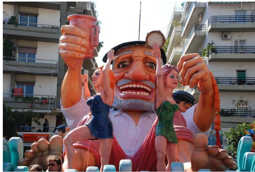
Εικόνα 4γ. Άρμα καρναβαλιού

Σε κάθε γωνιά της πόλης συμβαίνει και ένα καλλιτεχνικό γεγονός όπως τα θέατρα δρόμου, εκθέσεις, εικαστικές δραστηριότητες, συναυλίες, χορευτικές δραστηριότητες με αποτέλεσμα όλη η πόλη να μετατρέπεται σε μια παράσταση με σκηνικό την ίδια την πόλη, και πρωταγωνιστές όλους τους κατοίκους και τους επισκέπτες.