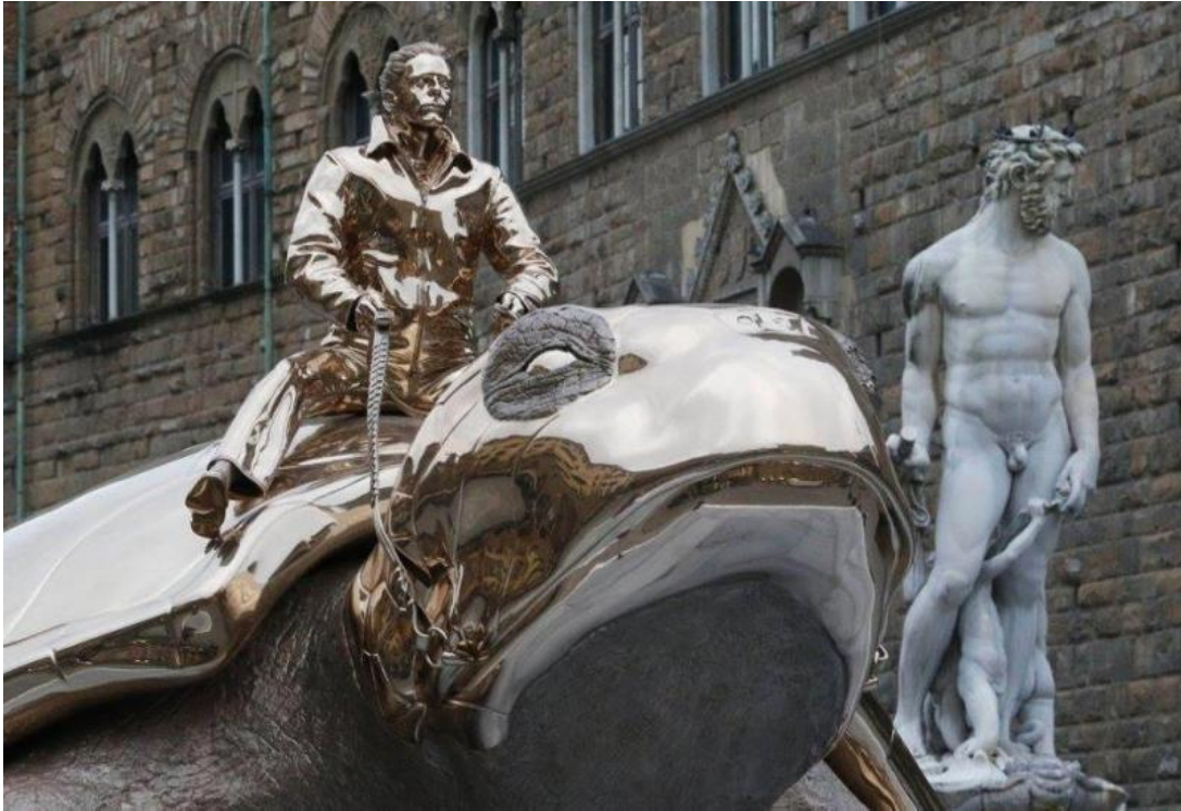
Εικόνα 12Φωτ. απο υπαίθρια έκθεση του Γιαν Φαμπρ

Ακόμα υπάρχουν πολλές υπαίθριες κινηματογραφικές αίθουσες όπου μία ταινία για να προβληθεί χρησιμοποιεί μια πρόσοψη ενός κτιρίου ως οθόνη. Σχεδόν σε όλες τις πλατείες κατά τους καλοκαιρινούς μήνες παρέχεται ψυχαγωγία κάθε βράδυ με φόντο τα γύρω κτίρια.