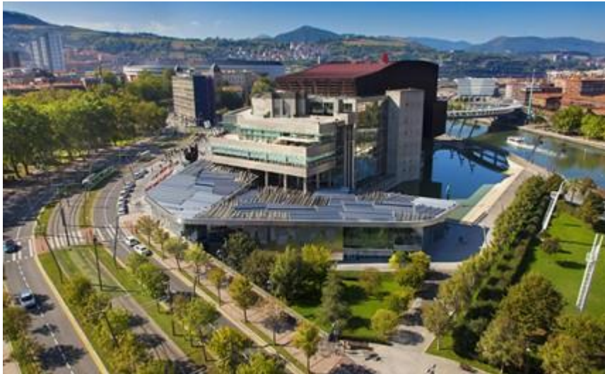
Εικόνα 2. Συνεδριακό κέντρο και μέγαρο μουσικής Εουσκαλντούνα