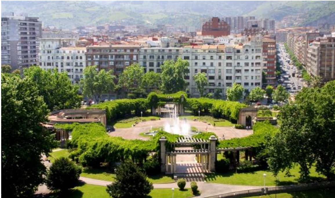
Εικόνα 12. Πάρκο Doña Casilda