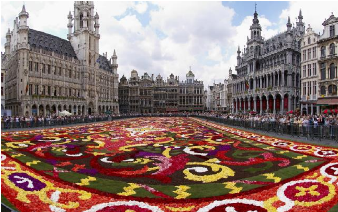
Εικόνα 6. Πλατεία Μεγάλης Αγοράς “Grand Place / Grote Markt”

Επίσης, η πόλη κινείται εκτός των άλλων σε έναν άξονα οικολογίας έχοντας μάλιστα καθιερώσει το φεστιβάλ οικολογικού περιεχομένου “Car-free Sunday”, προτρέποντας στους κατοίκους να μην χρησιμοποιούν τα αυτοκίνητα τους στο κέντρο κάποιες Κυριακές.