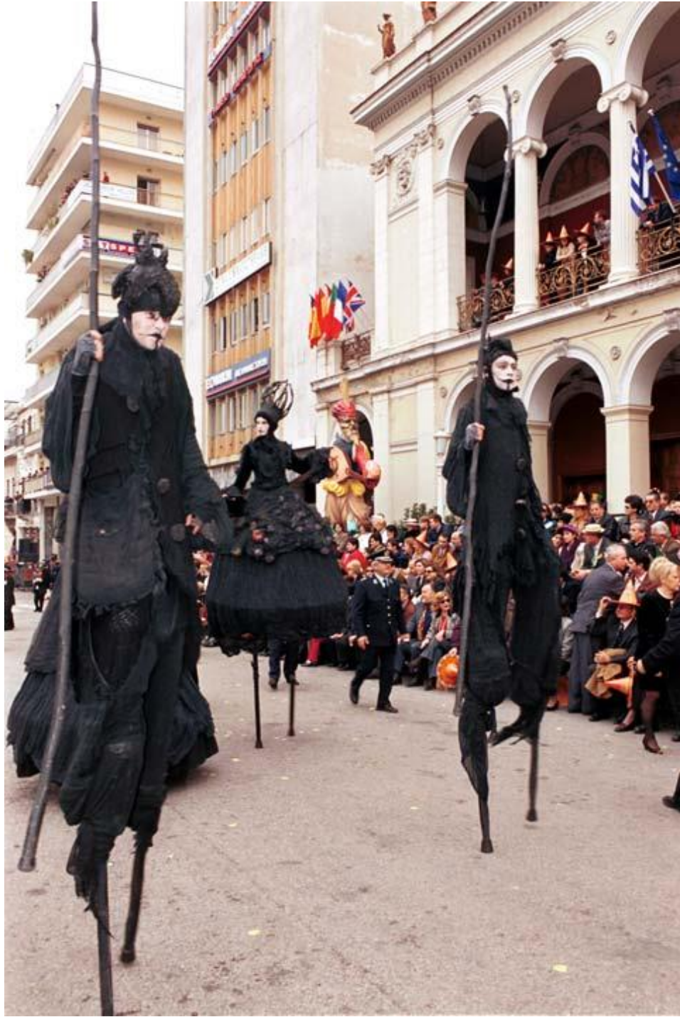
Εικόνα 6β. Μεγάλη παρέλαση