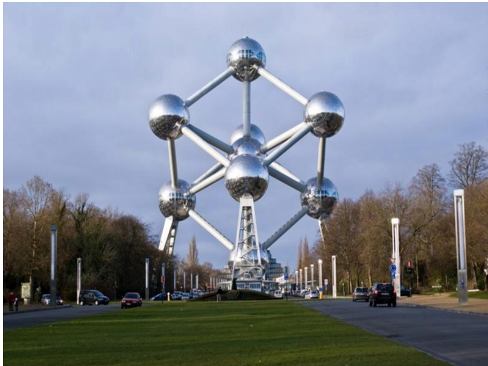
Εικόνα 4.Μνημείο του Ατόμου“Atomium”

Επιπλέον η πόλη έχει να επιδείξει και σημαντικά μνημεία αρχιτεκτονικής όπως είναι το Βασιλικό παλάτι των Βρυξελλών, ο Καθεδρικός Ναός των Βρυξελλών, η Βασιλική της Ιερής καρδιάς και άλλα σημαντικά μνημεία.