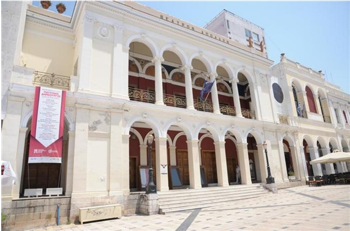
Εικόνα 8..Δημοτικό Θέατρο «ΑΠΟΛΛΩΝ» του Γερμανού Αρχιτέκτονα Ερνέστου Τσίλερ, 1872