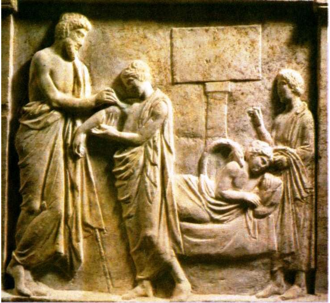
Εικόνα 1: Ιατρική στην Αρχαιότητα.