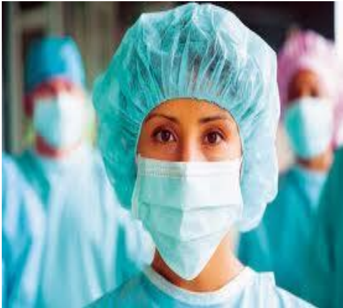
Εικόνα 3: Νοσηλεύτρια Χειρουργείου.