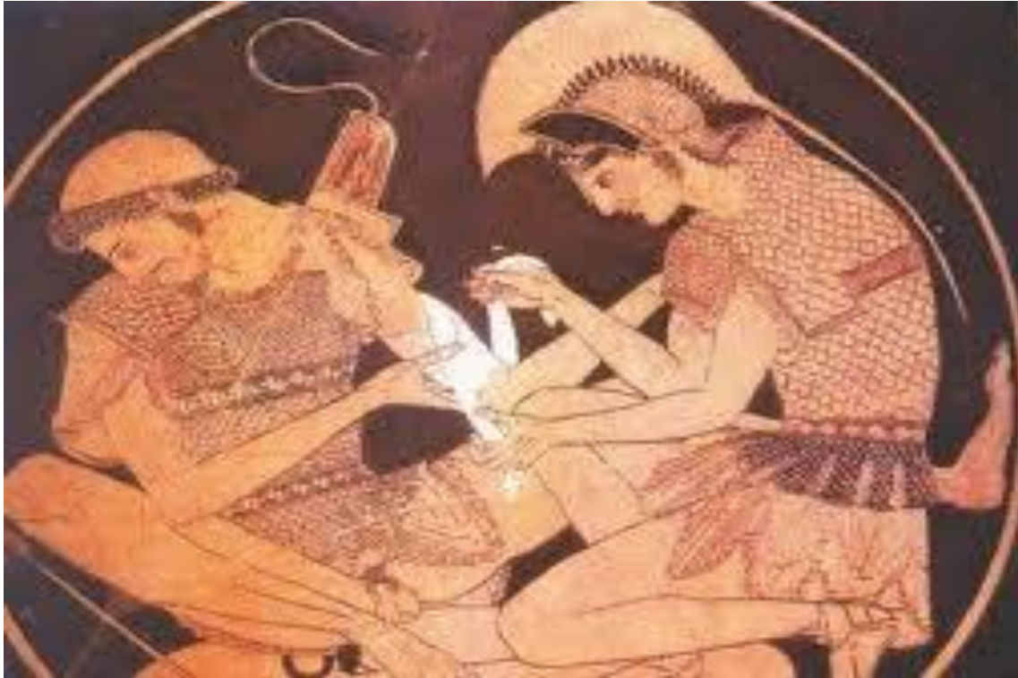
Εικόνα 2: Η φροντίδα στην Αρχαία Εποχή.