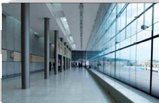
Εικόνα 33 Αίθουσα του Παρθενώνα. Βάθρα και για την ανάπαυλα των επισκεπτών.