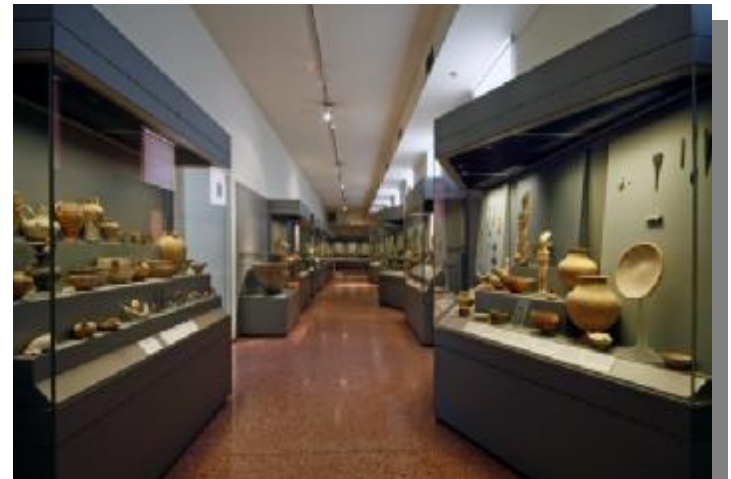
Εικόνα 10 Αίθουσα Κυκλαδικής Συλλογής του ΕΑΜ.