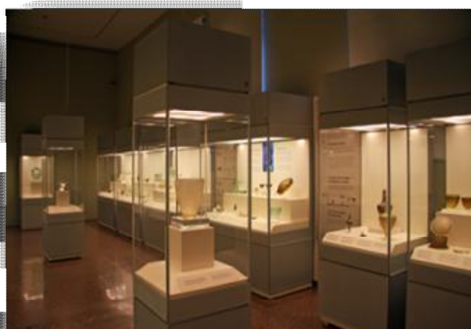
Εικόνα 18 Αίθουσα συλλογής γυάλινων αγγείων του ΕΑΜ.