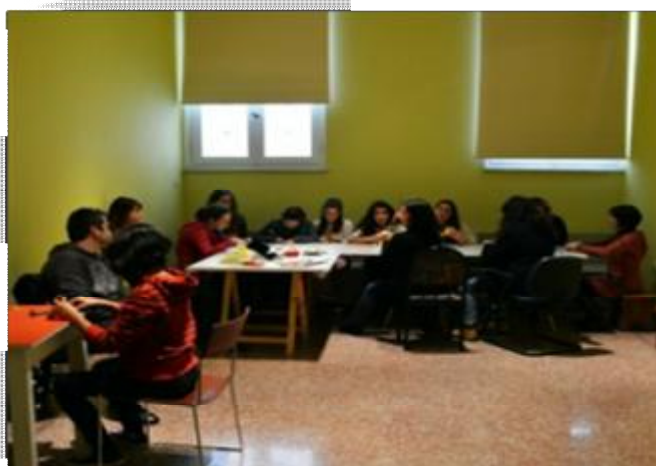
Εικόνα 24 Αίθουσα εκπαιδευτικών προγραμμάτων του ΕΑΜ.