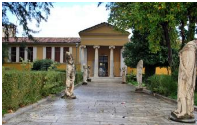
Εικόνα 2 Το Αρχαιολογικό Μουσείο της Σπάρτης με τις νεώτερες προσθήκες.