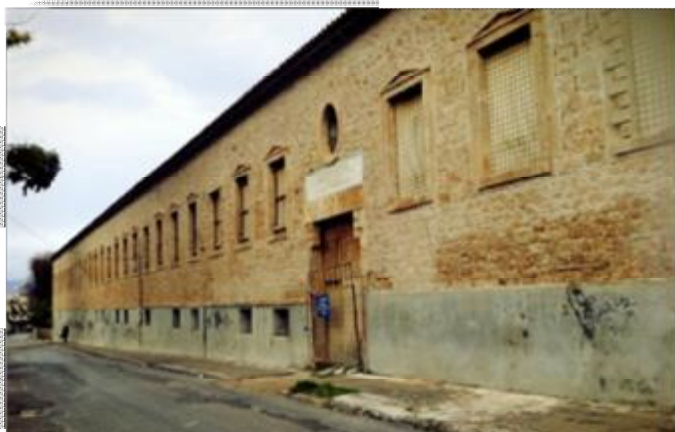
Εικόνα 1 Το Εθνικό Μουσείο της Αίγινας.