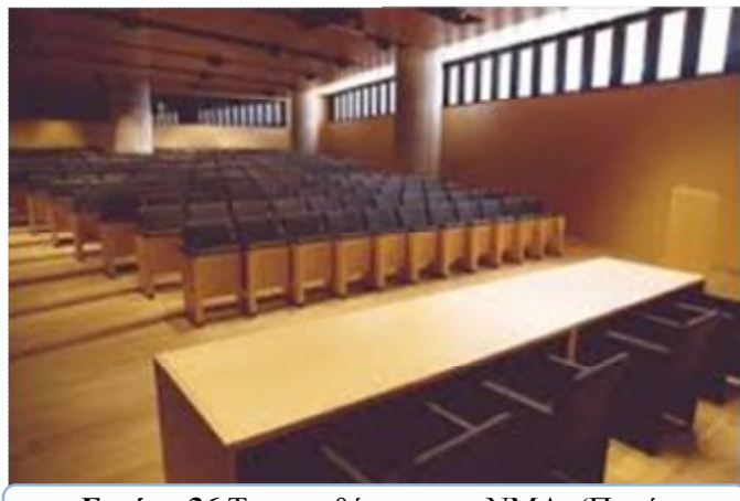
Εικόνα 36 Το αμφιθέατρο του ΝΜΑ.