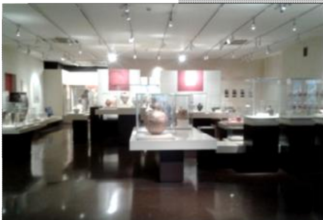
Εικόνα 11 Η έκθεση της Θήρας του ΕΑΜ.