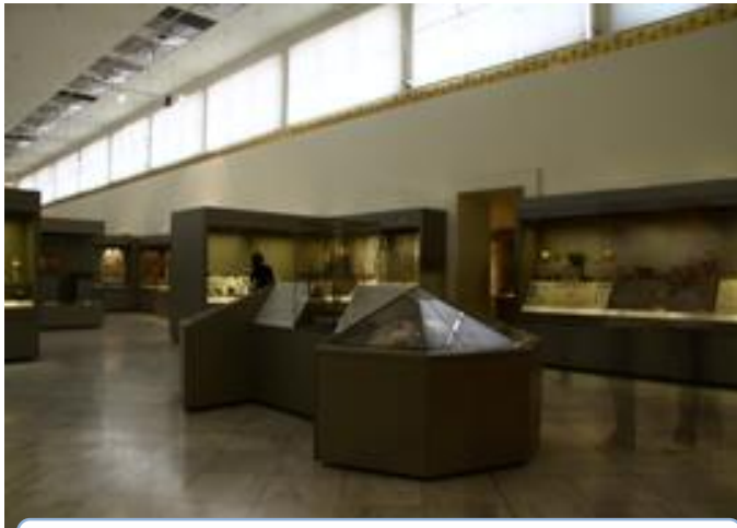
Εικόνα 9 Αίθουσα Μυκηναϊκής συλλογής του ΕΑΜ.