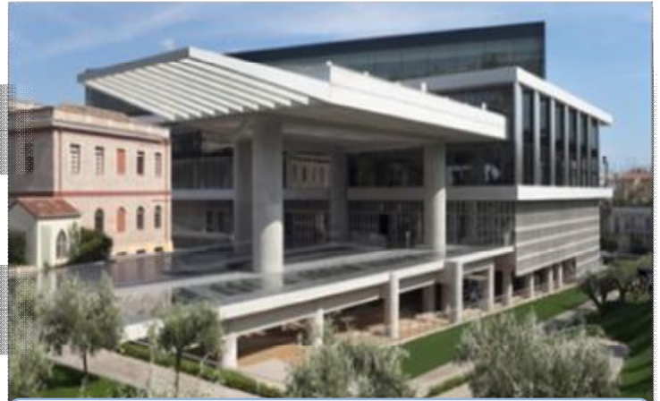
Εικόνα 26 Το Νέο Μουσείο Ακρόπολης.