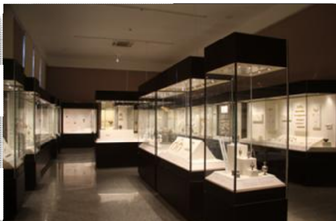
Εικόνα 20 Αίθουσα συλλογής κοσμημάτων του ΕΑΜ.