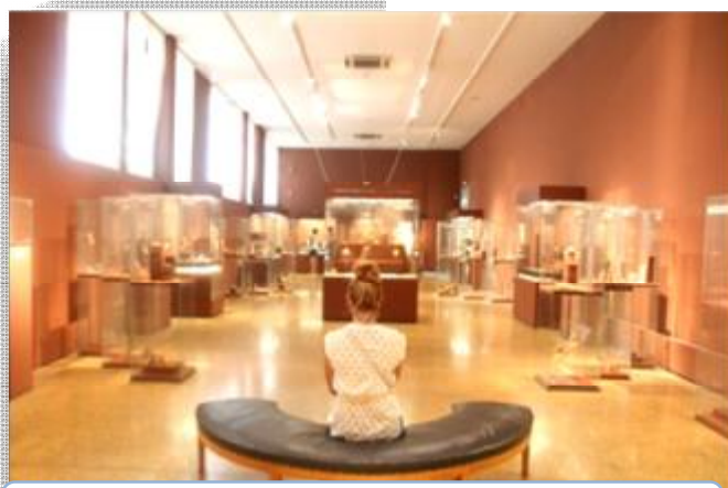
Εικόνα 16 Αίθουσα συλλογής του Σταθάτου του ΕΑΜ.