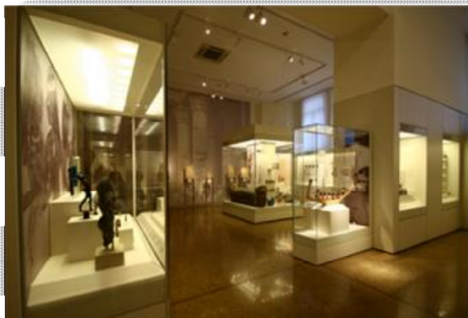
Εικόνα 21 Αίθουσα συλλογής Αιγυπτιακών του ΕΑΜ.