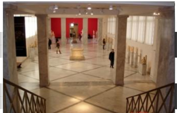
Εικόνα 12 Αίθουσα συλλογής Γλυπτών του ΕΑΜ.