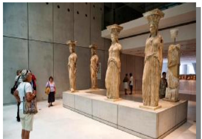
Εικόνα 30 Αίθουσα Καρυάτιδων του ΝΜΑ.