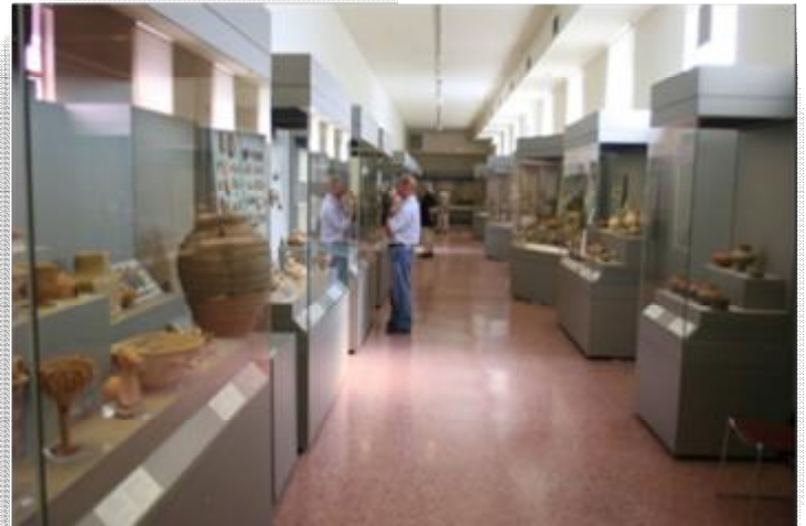
Εικόνα 8 Αίθουσα Νεολιθικής Συλλογής του ΕΑΜ.