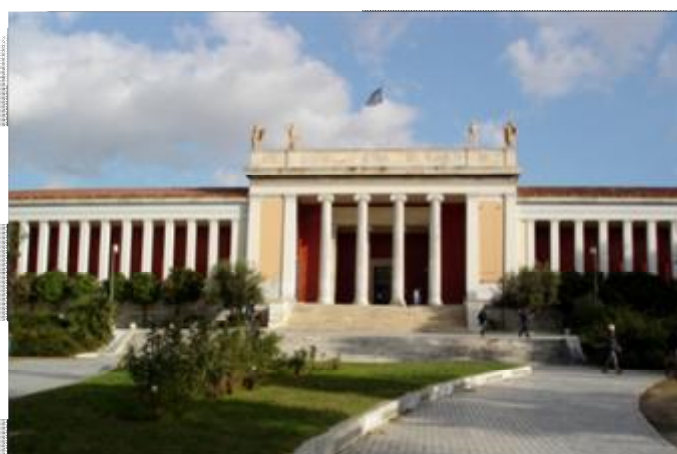
Εικόνα 4 Το Εθνικό Αρχαιολογικό Μουσείο της Αθήνας.