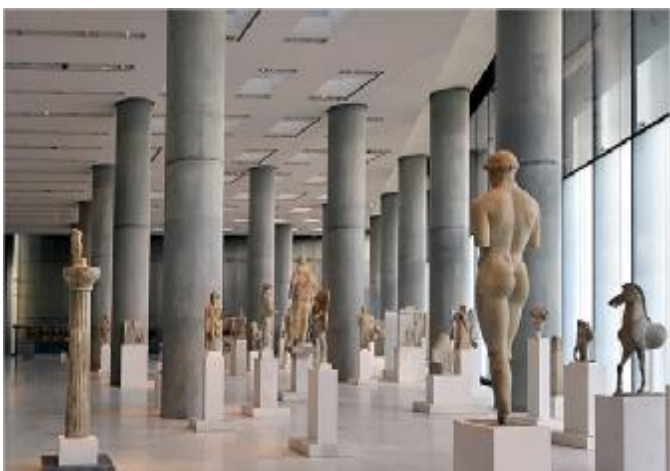
Εικόνα 29 Αίθουσα Αρχαϊκών Έργων.