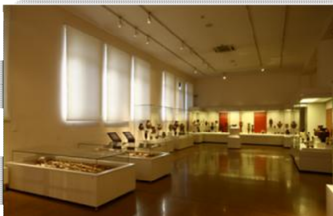
Εικόνα 15 Αίθουσα συλλογής αγγείων και μικροτεχνίας του ΕΑΜ.