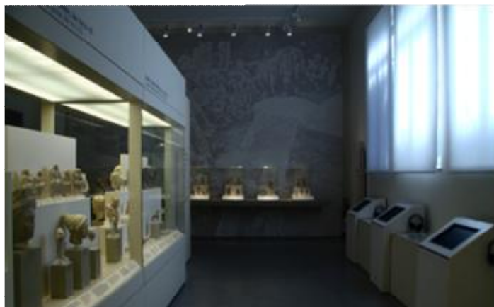
Εικόνα 22 Αίθουσα συλλογής Κυπριακών του ΕΑΜ.