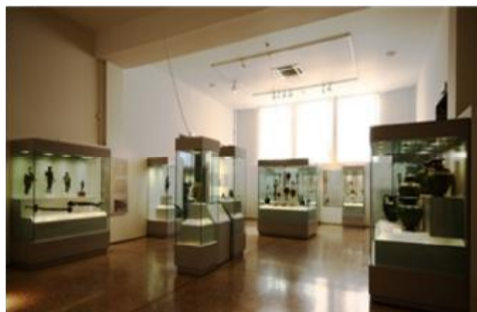
Εικόνα 14 Αίθουσα έργων μεταλλοτεχνίας του ΕΑΜ.