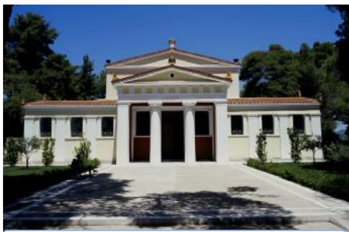
Εικόνα 3 Το παλιό μουσείο της Ολυμπίας.