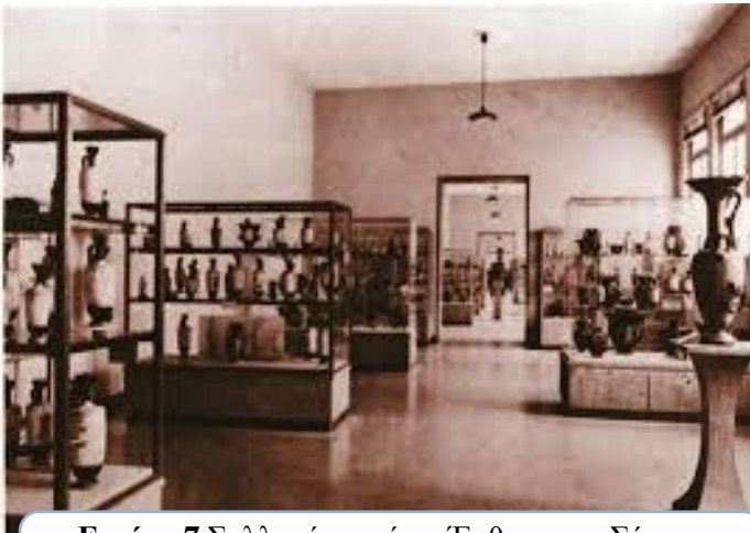
Εικόνα 7 Συλλογή αγγείων. Έκθεση της Σέμνης Καρούζου.