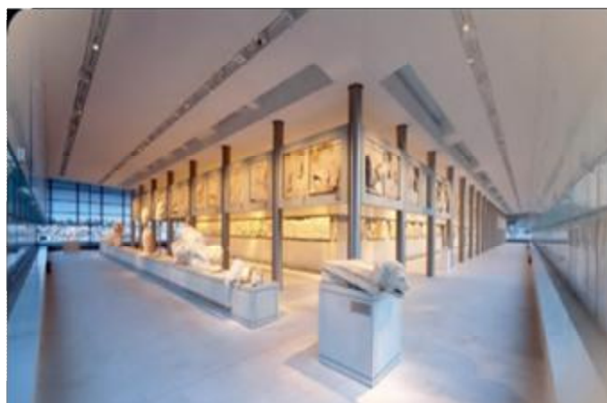
Εικόνα 32 Αίθουσα του Παρθενώνα.