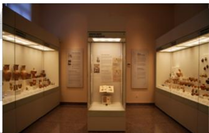
Εικόνα 17 Αίθουσα συλλογής Βλαστού-Σερπιέρη του ΕΑΜ.