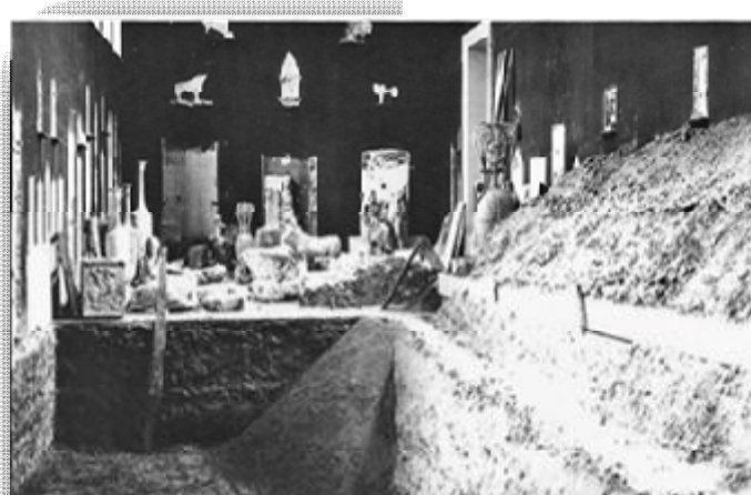
Εικόνα 6 Το Εθνικό Αρχαιολογικό Μουσείο κατά τον Β΄ Παγκόσμιο Πόλεμο.