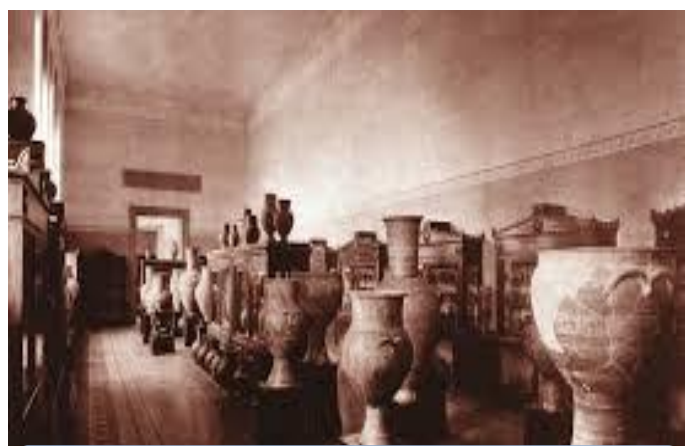
Εικόνα 5 Έκθεση αγγείων πριν από τον Β΄ Παγκόσμιο Πόλεμο (τέλη 19ου αιώνα).