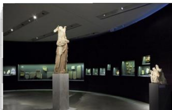
Εικόνα 34 Αίθουσα περιοδικών εκθέσεων του ΝΜΑ.