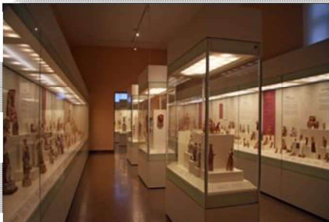
Εικόνα 19 Αίθουσα συλλογής πήλινων ειδωλίων του ΕΑΜ.