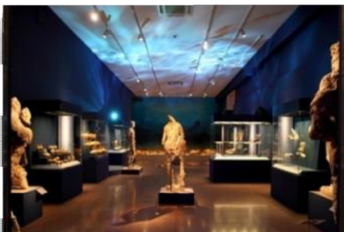
Εικόνα 23 Αίθουσα περιοδικών εκθέσεων του ΕΑΜ.