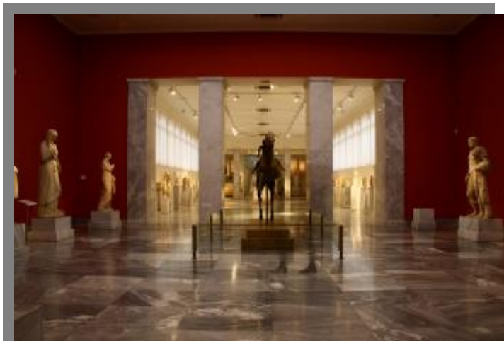
Εικόνα 13 Αίθουσα συλλογής Γλυπτών του ΕΑΜ.