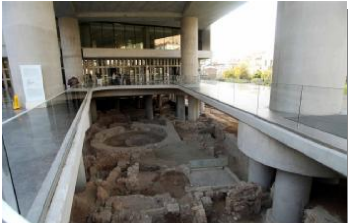
Εικόνα 27 Αρχαιολογική ανασκαφή.