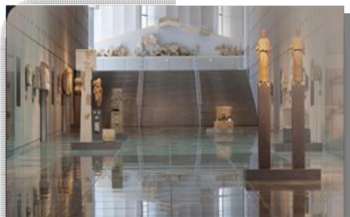
Εικόνα 28 Αίθουσα των Κλιτύων της Ακρόπολης.