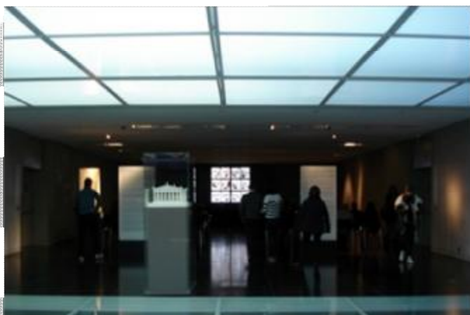
Εικόνα 31 Αίθουσα βιντεοπαρουσίασης.