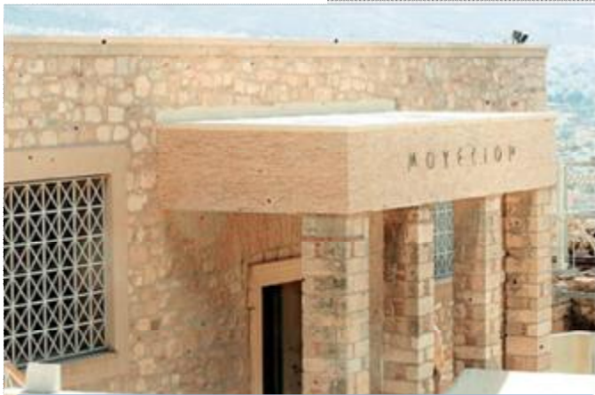
Εικόνα 25 Το Μουσείον Ακρόπολης.