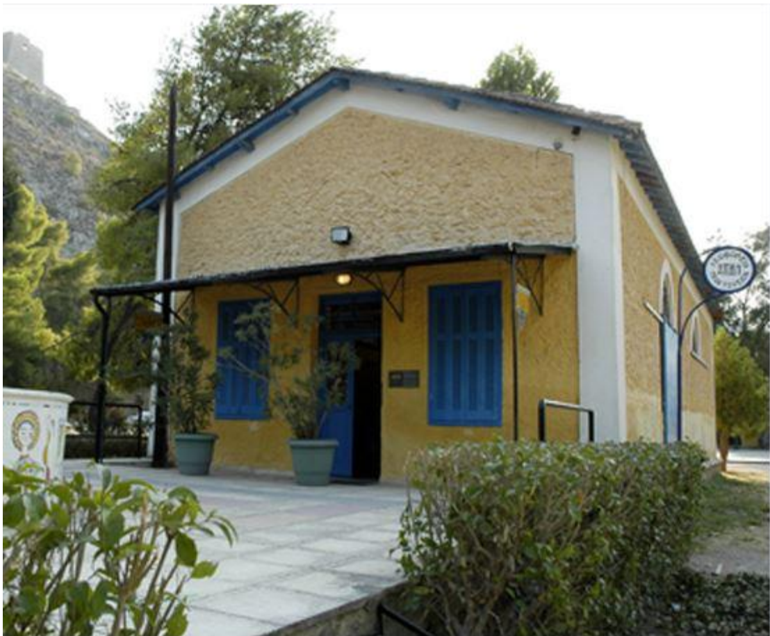
Εικόνα 4: Μουσείο Παιδικής Ηλικίας «Ο Σταθμός»

πάνινων κουκλών, πατινιών και άλλων παραδοσιακών αθυρμάτων). Αρκετά από τα παιχνίδια προέρχονται από δωρεές ιδιωτών, οι οποίες προσφέρουν, σε αντίθεση με τα παιχνίδια που αγοράζονται μέσω παλαιοπωλών, το πλεονέκτημα της συλλογής στοιχείων για τα κοινωνικά συμφραζόμενα και την ιστορία του αντικειμένου και κυρίως της καταγραφής των τρόπων που παίχτηκε και μεταποιήθηκε από τους μικρούς του ιδιοκτήτες. Η ένταξη των παιχνιδιών στο κοινωνικό τους πλαίσιο επιτυγχάνεται πληρέστερα στις ομάδες παιχνιδιών που έχουν συγκεντρωθεί μετά από επιτόπια έρευνα. Στον «Σταθμό» εκτίθεται ένα μικρό τμήμα (περίπου το 10%) από τις συλλογές του ΠΛΙ που αφορούν το παιδί. (Πελοποννησιακό Λαογραφικό Ίδρυμα http://www.pli.gr/el/content/μουσειο-παιδικης-ηλικιας-ο-σταθμος , Μουσείο παιδικής ηλικίας ο «Σταθμός»)