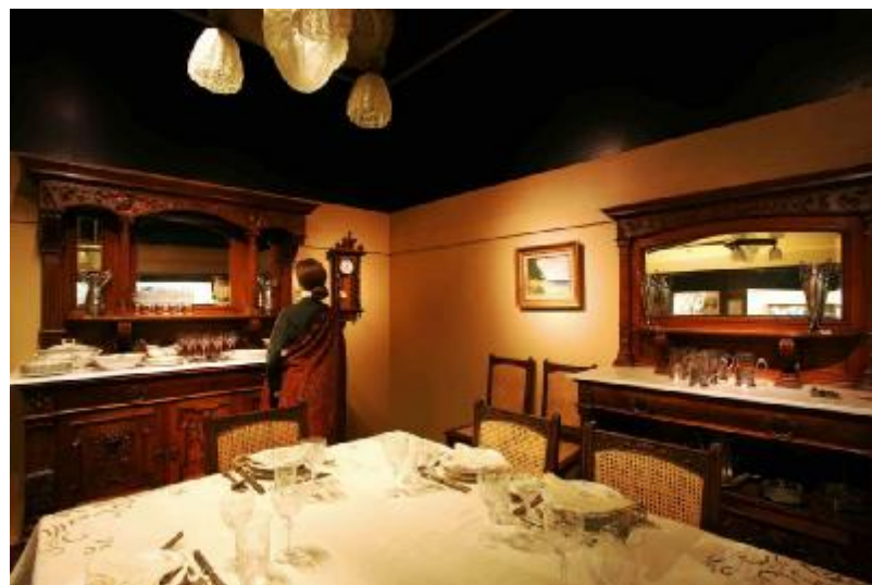
Εικόνα 10: Οι συλλογές: Ένα ταξίδι στον χώρο και στον χρόνο

Το 2015 , η νέα μόνιμη έκθεση με τον τίτλο “Οι συλλογές: Ένα ταξίδι στον χώρο και στον χρόνο” αφιερώνεται στις συλλογές του Ιδρύματος, που σήμερα αριθμούν περίπου 45.000 αντικείμενα.