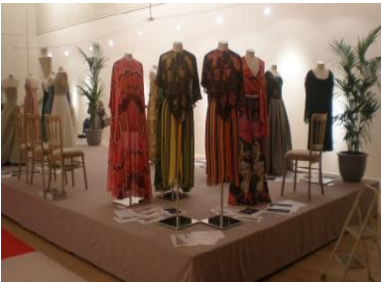
Εικόνα 16: Λονδίνο 2012