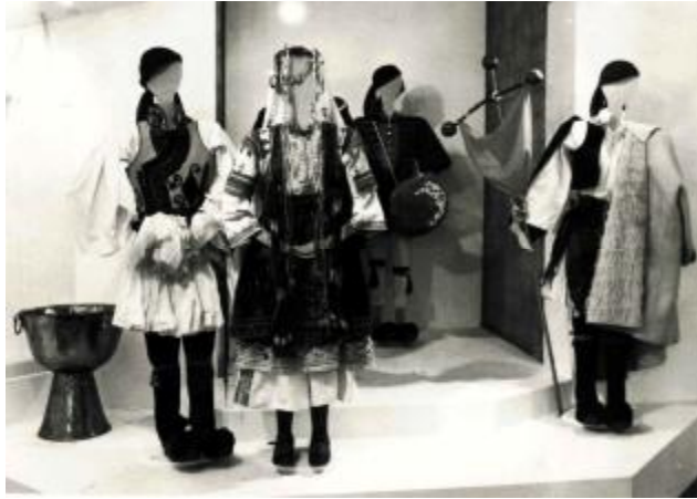
Εικόνα 11: Βρυξέλες 1982 – Ευρωπαϊκά. Τρεις κύκλοι της ζωής

Το ΠΛΙ έχει οργανώσει πολλές εκθέσεις στην Ελλάδα και το εξωτερικό, με πιο σημαντικές: