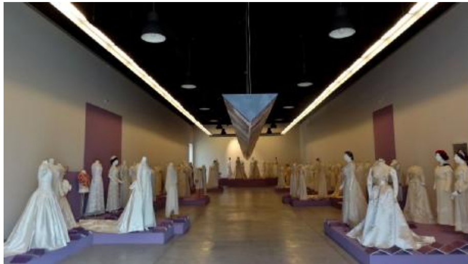
Εικόνα 9: Νύφες. Παράδοση και μόδα στην Ελλάδα

"Νύφες. Παράδοση και μόδα στην Ελλάδα" , ήταν η δεύτερη έκθεση, στην οποία παρουσιάστηκε μια μεγάλη γκάμα νυφικών ενδυμάτων από τις συλλογές του ΠΛΙ, από τα κομψά και περίτεχνα νυφικά του τέλους του 19ου αιώνα έως τις πρωτοποριακές δημιουργίες των σύγχρονων σχεδιαστών και τις εκκεντρικές εμφανίσεις των νυφών του 21ου αι. Η έκθεση φιλοξενήθηκε στο νέο κτίριο του Μουσείου Μπενάκη στην Πειραιώς και εμπλουτισμένη με 38 νέες δωρεές παρουσιάστηκε στο Φουγάρο στο Ναύπλιο. (Πελοποννησιακό Λαογραφικό Ίδρυμα, http://www.pli.gr/el/content/χρονολόγιο-πλι , Χρονολόγιο ΠΛΙ)