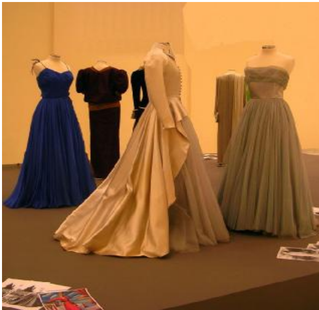
Εικόνα 15: Αθήνα 2006 - 4η Ελληνική Εβδομάδα Μόδας