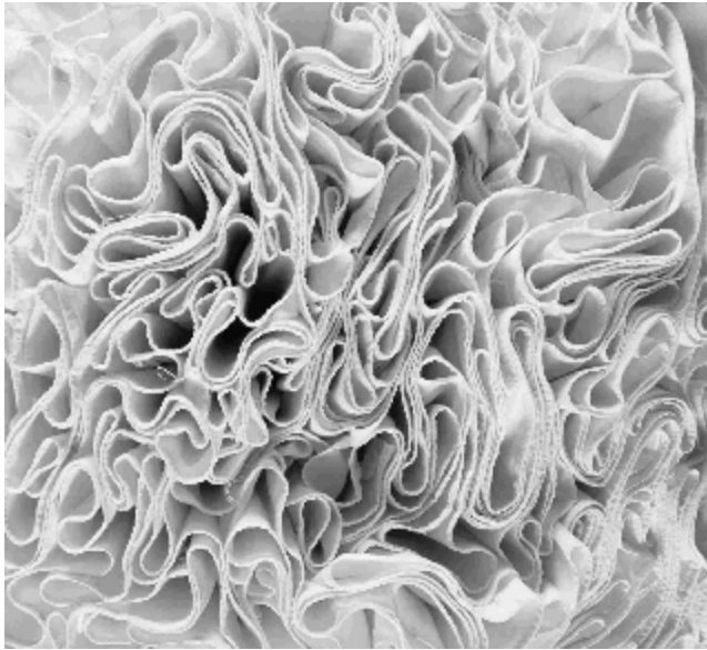
Εικόνα 14: Αθήνα 2004 - Πολιτιστική Ολυμπιάδα

Πτυχώσεις. Από το αρχαίο ελληνικό ένδυμα στη μόδα του 20ού αιώνα