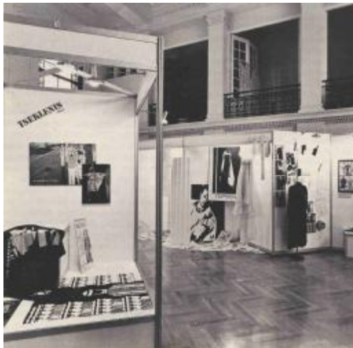
Εικόνα 12: Αθήνα 1985 - Αθήνα Πολιτιστική Πρωτεύουσα της Ευρώπης. Η ελληνική φορεσιά και το κόσμημα άλλοτε και τώρα