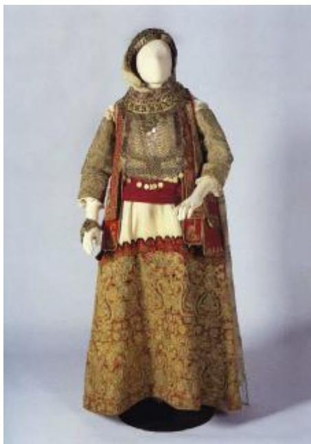
Εικόνα 13: Ντάλας (Τέξας) 1990 - Salute to Greece (Ελληνική χρονιά) Η ελληνική φορεσιά