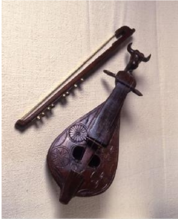
Εικόνα 38: Λύρα. Κρήτη, Λασιθί. Δωρεά: Ιωάννα Παπαντωνίου.