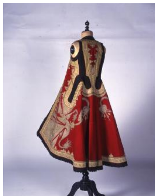
Εικόνα 18: «Ντουλαμάς». Πανωφόρι κόκκινο με κέντημα. Πελοπόννησος. Τέλη 19 ου αι. Δωρεά: Ιωάννα Παπαντωνίου