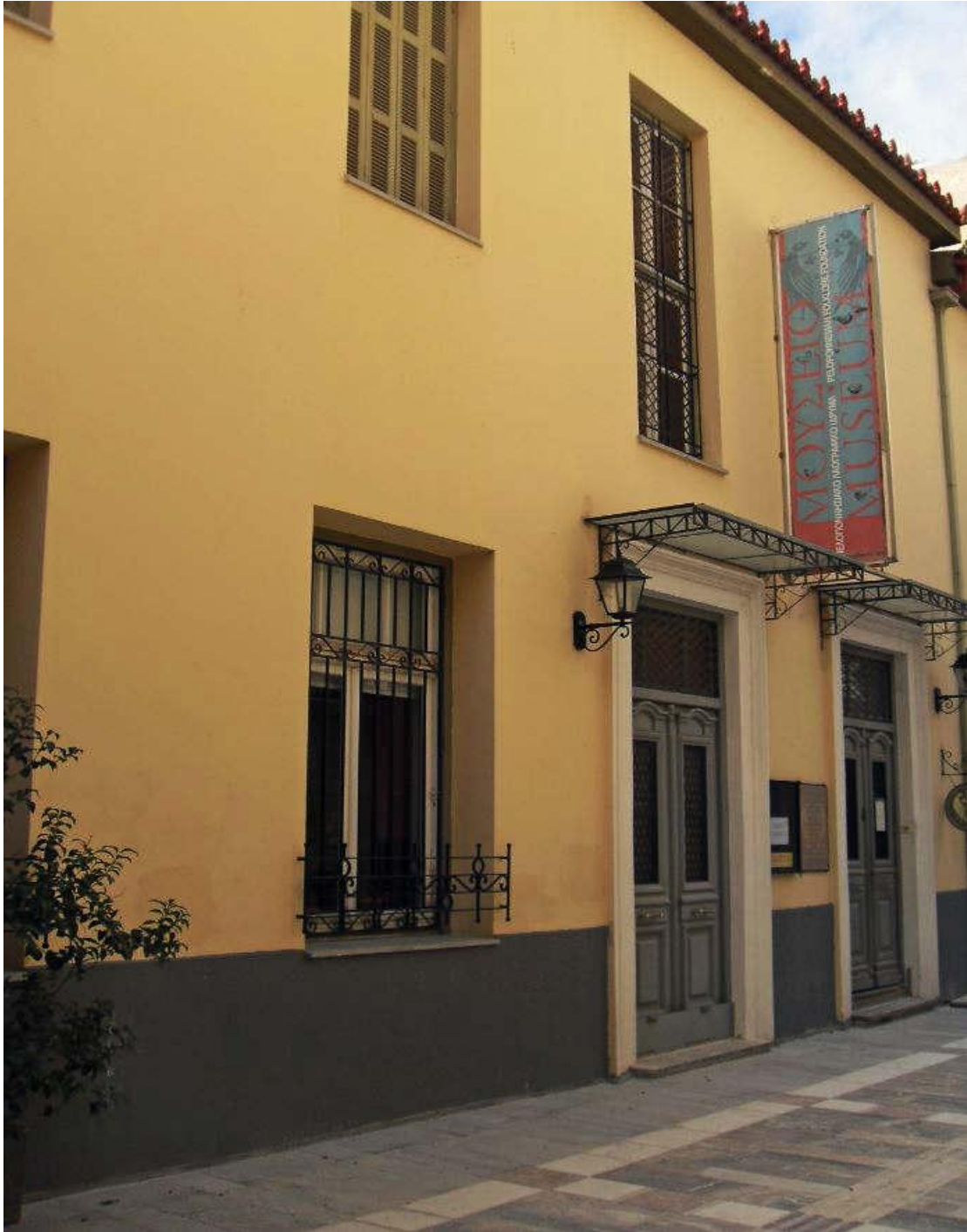
Εικόνα 1: Πελοποννησιακό Λαογραφικό Ίδρυμα Β. Παπαντωνίου