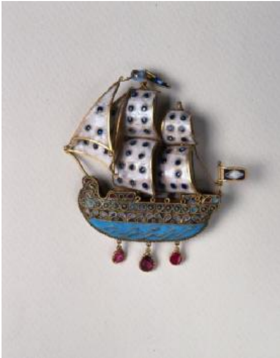
Εικόνα 26: Σκουλαρική καράβι, επισμαλτωμένο με ρουμπίνια. Δωδεκάνησα, Πάτμος.