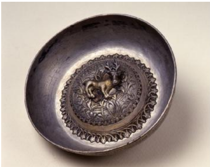
Εικόνα 31: Τάσι με δικέφαλο αετό και επιγραφή «ΑΡΧΙΜΑΝΔΡΙΤΗΣ ΔΙΟΝΥΣΙΟΣ». 19ος αι.