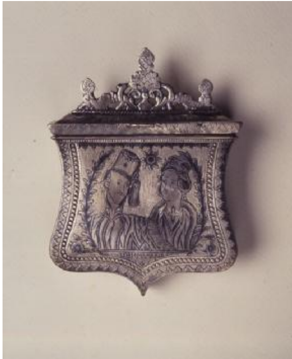
Εικόνα 29: Παλάσκα ασημένια, με τους πρώτους βασιλείς της Ελλάδας Όθωνα και Αμαλία. 19ος αι.