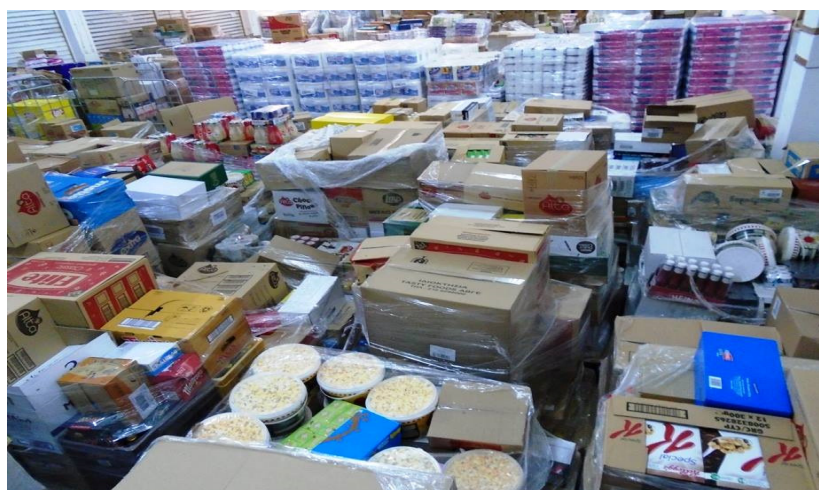
Εικόνα 7 Τρόφιμα που συγκεντρώνονται στις αποθήκες της τράπεζας

Συγκεκριμένα, όπως διατυπώνεται και στην σελίδα του φορέα, «σήμερα ακόμη περισσότερο από ποτέ, την εποχή της σοβαρής οικονομικής κρίσης που περνάει η Ελλάδα, ένα πολύ μεγάλο ποσοστό ανθρώπων της σύγχρονης Ελλάδας