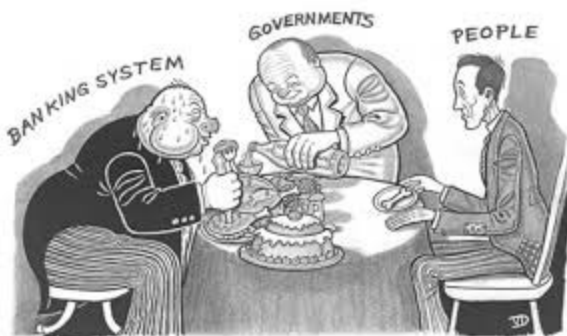
Εικόνα 1 Σκίτσο για την κρίση

Ειδικότερα, το ζήτημα της οικονομικής κρίσης, σχετίζεται με κοινωνίες στις οποίες