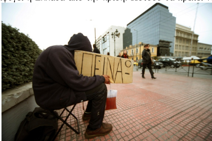
Εικόνα 2 Αντίκτυπο της κρίσης

γίνει μία σωστή εκτίμηση των πραγματικών συνθηκών για να δημιουργηθεί ένα κατάλληλο σχέδιο δράσης. Ακόμα, ιδιαίτερο είναι το ζήτημα της ενίσχυσης των ατόμων που έχουν πληγεί περισσότερο από την κρίση.