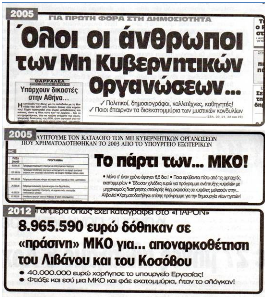
Εικόνα 2: άρθρα εφημερίδων σχετικά με τη διαπλοκή των ΜΚΟ

Αυτό το κενό μεταξύ πολιτείας και κοινωνία έπρεπε να καλυφτεί από την Κοινωνία των Πολιτών και όχι από πρωτοβουλίες που αρκετές φορές ήταν ιδιοτελείς. Αυτό προκύπτει από τις έρευνες οι οποίες ανακαλύπτουν ότι μικρός αριθμός ΜΚΟ επιτελεί το έργο τους με διαφάνεια και εντιμότητα. Σήμερα είναι πλέον γνωστό ότι ΜΚΟ, στις ΗΠΑ και σε Ευρωπαϊκές χώρες, δημιουργήθηκαν και χρηματοδοτήθηκαν για να λειτουργήσουν ως μηχανισμοί διείσδυσης,