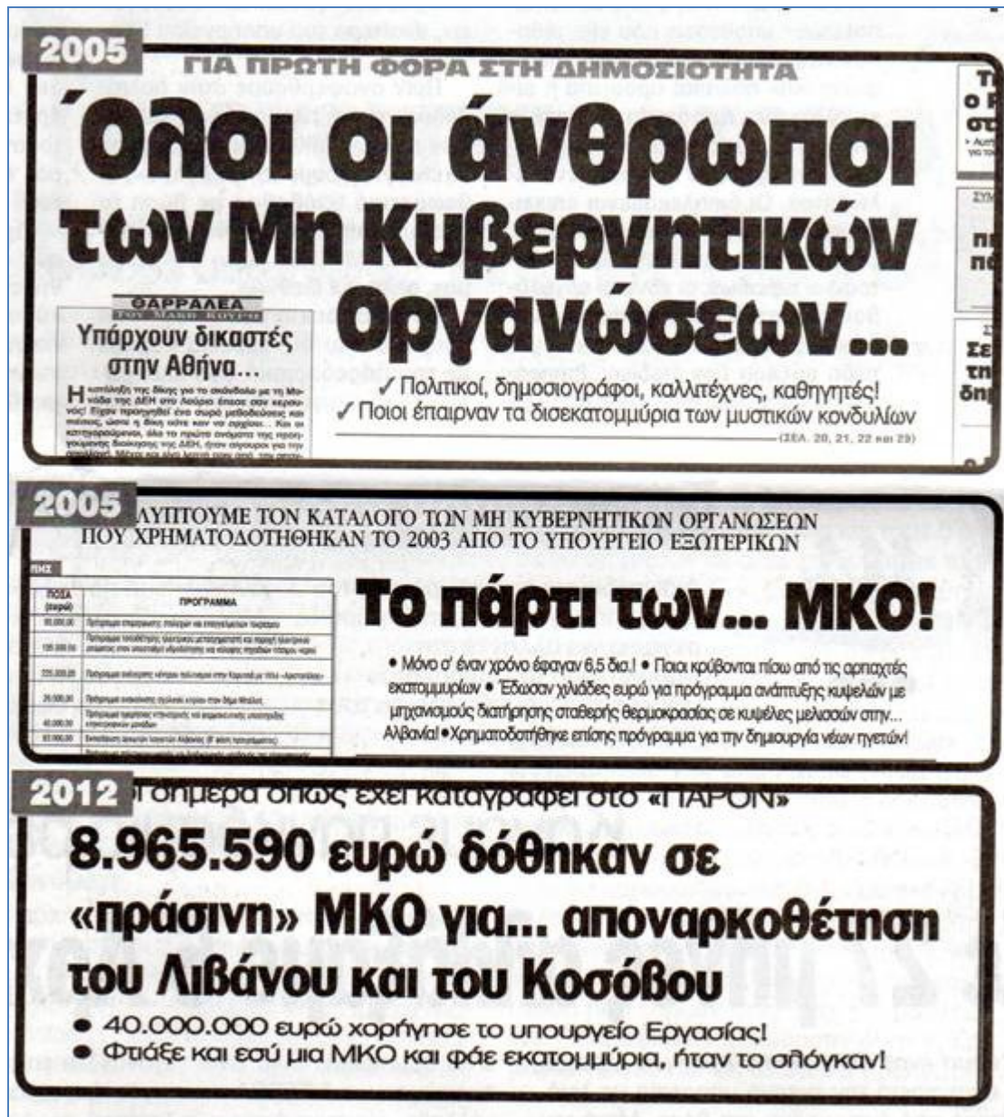
Εικόνα 2: άρθρα εφημερίδων σχετικά με τη διαπλοκή των ΜΚΟ

Αυτό το κενό μεταξύ πολιτείας και κοινωνία έπρεπε να καλυφτεί από την Κοινωνία των Πολιτών και όχι από πρωτοβουλίες που αρκετές φορές ήταν ιδιοτελείς. Αυτό προκύπτει από τις έρευνες οι οποίες ανακαλύπτουν ότι μικρός αριθμός ΜΚΟ επιτελεί το έργο τους με διαφάνεια και εντιμότητα. Σήμερα είναι πλέον γνωστό ότι ΜΚΟ, στις ΗΠΑ και σε Ευρωπαϊκές χώρες, δημιουργήθηκαν και χρηματοδοτήθηκαν για να λειτουργήσουν ως μηχανισμοί διείσδυσης,