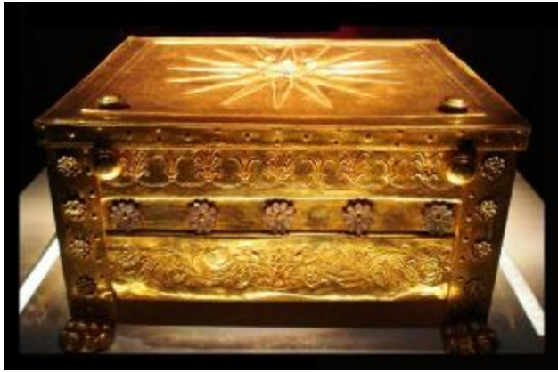
ΕΙΚΟΝΑ 1:Χρυσή Λάρνακα Φιλίππου Β΄

σύμβολο της μακεδονικής δυναστείας και μια μικρότερη λάρνακα με το δωδεκάκτινο αστέρι. Εξαιρετικής τέχνης και αξίας είναι τα διαδήματα (στεφάνια) από φύλλα και καρπούς βελανιδιάς.( Μ.Ανδρόνικος,"Ανασκαφή στη Μεγάλη Τούμπα της Βεργίνας" 1976)