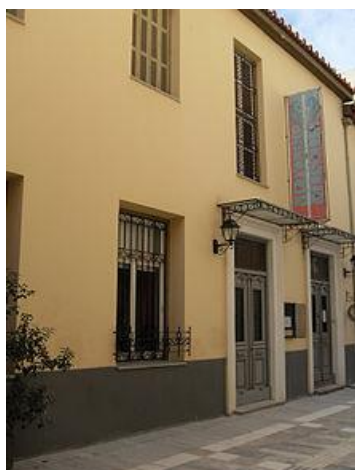
ΕΙΚΟΝΑ 2: Πελοποννησιακό Λαογραφικό Ίδρυμα «Βασίλειος

Περιπλανώμενος κάποιος σε διάφορα μέρη της Ελλάδας, θα συναντήσει σίγουρα κάποιο λαογραφικό μουσείο που θα εξιστορεί την ιστορία του τόπου και θα την διαφυλάσσει μέσα στο πέρασμα του χρόνου. Στη συνέχεια θα αναφερθούμε σε τρία λαογραφικά μουσεία που διαφέρουν σε κάποια στοιχεία, αλλά έχουν έναν κοινό στόχο, τη διαφύλαξη της λαογραφίας του πολιτισμού μας.