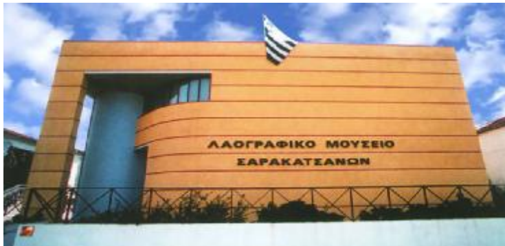
ΕΙΚΟΝΑ 3: Λαογραφικό Μουσείο Σαρακατσάνων

Αυτό είναι λοιπόν το Πελοποννησιακό Λαογραφικό Ίδρυμα «Βασίλειος Παπαντωνίου και ο τρόπος που τεκμηριώνει την εκτενή λαογραφική του συλλογή. Επίσης διαθέτει Κέντρο Έρευνας, Διοικητικές υπηρεσίες, Βιβλιοθήκη και στον Παλιό σιδηροδρομικό σταθμό που του παραχώρηθηκε από το Δήμο Ναυπλιέων στεγάζει το Παιδικό Μουσείο «Σταθμός» όπου πραγματοποιούνται πολλά εκπαιδευτικά προγράμματα.