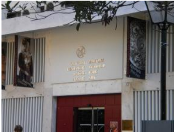
ΕΙΚΟΝΑ 4: Μουσείο Ελληνικής Λαϊκής Τέχνης

Το τρίτο λαογραφικό μουσείο που θα αναφερθούμε είναι το Μουσείο Ελληνικής Λαϊκής Τέχνης είναι δημόσιο Μουσείο και αποτελεί Ειδική Περιφερειακή Μονάδα του Υπουργείου Πολιτισμού, ως τώρα έχει χαράξει μια μακρά πορεία. Πρωτοιδρύθηκε το 1918, με την επωνυμία «Μουσείον Ελληνικών Χειροτεχνημάτων» και στεγαζόταν στο παραχωρημένο Τζαμί του Κάτω Συντριβανιού ή Τζαμί Τζισδαράκη. Το 1923 μετονομάζεται σε «Εθνικόν Μουσείον Κοσμητικών Τεχνών» και το 1931 το Μουσείο, έχοντας ως πρότυπο ευρωπαϊκά μουσεία ίδιου περιεχομένου, μετονομάστηκε σε «Μουσείον Ελληνικής Λαϊκής Τέχνης» όπως και παραμένει έως σήμερα. Από την διοίκησή του πέρασαν μέσα σε αυτά τα χρόνια πολλοί άνθρωποι που το αγάπησαν και πάλεψαν για την καθιέρωσή του. Ενδεικτικά αναφέρουμε τον ποιητή Γεώργιο Δροσίνη που επιτελούσε τότε το έργο του προϊστάμενου του τμήματος Γραμμάτων και Τεχνών του Υπουργείου των Εκκλησιαστικών και της Δημόσιας Εκπαιδεύσεως και ήταν ένα από τα ιδρυτικά στελέχη του Μουσείου. Το μουσείο τώρα βρίσκεται σε κατάσταση μεταστέγασης.