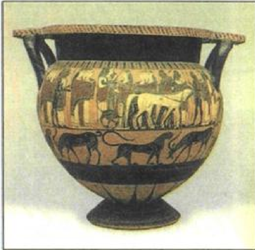
Εικόνα 2: Γαμήλια πομπή από κορινθιακό κρατήρα (560 π.Χ., Βατικανό). Η μεγαλοπρέπεια της γαμήλιας πομπής υποδηλώνει τη σημασία του γάμου για την κοινωνική και πολιτική ζωή.

Το βασικότερο αντικείμενο συζήτησης στο πλαίσιο της εγγύης ήταν η προίκα, που αποτελούσε το κύριο γνώρισμα ενός νόμιμου γάμου. Ο πατέρας ήταν υποχρεωμένος να δώσει στην κόρη του τουλάχιστον το 1/10 της περιουσίας του ως προίκα, συνήθως σε χρήμα, οικιακά σκεύη, ρούχα, έπιπλα και κοσμήματα. Η ακίνητη περιουσία προοριζόταν για τα αγόρια, και με τον τρόπο αυτό περιοριζόταν, όσο ήταν δυνατό, ο κατακερματισμός της. Η προίκα δεν αποτελούσε ιδιοκτησία του γαμπρού μετά το γάμο. Αντίθετα, σε περίπτωση που αποφάσιζε να χωρίσει από τη σύζυγο του, είχε την υποχρέωση να την επιστρέψει στην οικογένεια της. Έτσι, η προίκα λειτουργούσε και ως μέσο αποτροπής του διαζυγίου. Στη Σπάρτη, σε περίπτωση διαζυγίου ή χηρείας, η προίκα δεν επιστρεφόταν στην οικογένεια της νέφης, αλλά παρέμενε στην ίδια. Σύμφωνα με τον Αριστοτέλη, τον 4ο αιώνα π.Χ. τα 2/5 της λακωνικής γης ανήκαν σε γυναίκες, κάτι που θεωρείται απαράδεκτο από το μεγάλο φιλόσοφο. 7