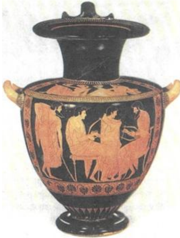
Εικόνα 7: Μάθημα μουσικής (παράσταση από αττική υδρία, 510 π.Χ., Αρχ. Μουσ. Μονάχου). Η μουσική αποτέλεσε ένα από τα βασικά στοιχεία της αρχαίας ελληνικής εκπαίδευσης από την ομηρική μέχρι την ελληνιστική εποχή