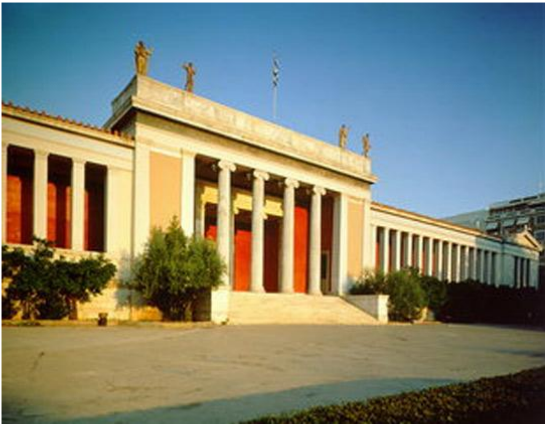
Εικόνα 8: Πρόσωση του Εθνικού Αρχαιολογικού Μουσείου

Το Εθνικό Αρχαιολογικό Μουσείο είναι το μεγαλύτερο μουσείο της Ελλάδας και ένα από τα σημαντικότερα του κόσμου. Με αρχικό προορισμό να δεχθεί το σύνολο των ευρημάτων από ανασκαφές του 19ου αιώνα, κυρίως από την Αττική, αλλά και από άλλες περιοχές της χώρας, σταδιακά πήρε τη μορφή ενός κεντρικού Εθνικού Αρχαιολογικού Μουσείου και εμπλουτίστηκε με ευρήματα από όλα τα σημεία του ελληνικού κόσμου. Οι πλούσιες συλλογές του, που απαριθμούν περισσότερα από 11.000 εκθέματα, προσφέρουν στον επισκέπτη ένα πανόραμα του αρχαίου ελληνικού πολιτισμού από τις αρχές της προϊστορίας έως την ύστερη αρχαιότητα.