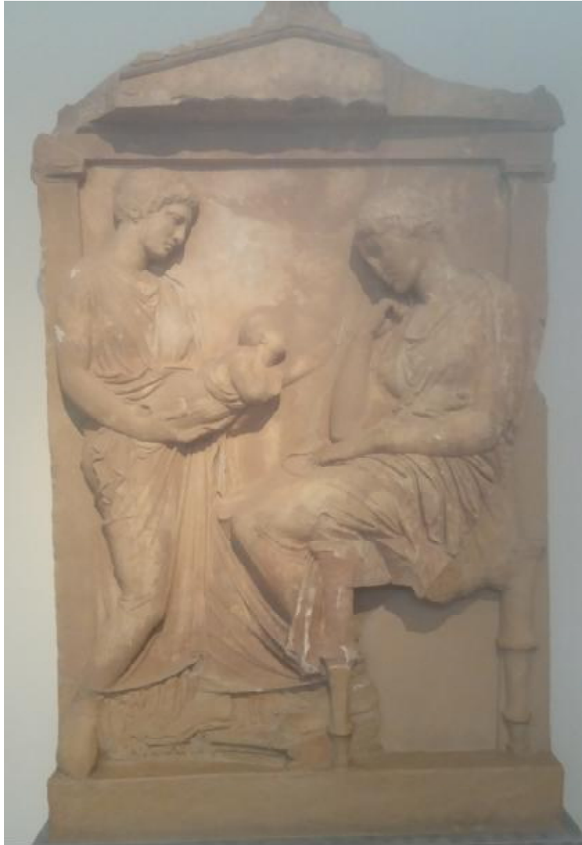
Εικόνα 14: Επιτύμβια στήλη από πεντελικό μάρμαρο. Η στήλη βρέθηκε στο Ψυχικό. Μια νέα μητέρα καθισμένη κοιτάζει με λύπη το μωρό της, που αποτην αγκαλιά μιας άλλης όρθιας γυναίκας της απλώνει το χέρι. Υπολογίζεται πως φιλοτεχνήθηκε το πρώτο τέταρτο του 4ου αιώνα π.Χ.