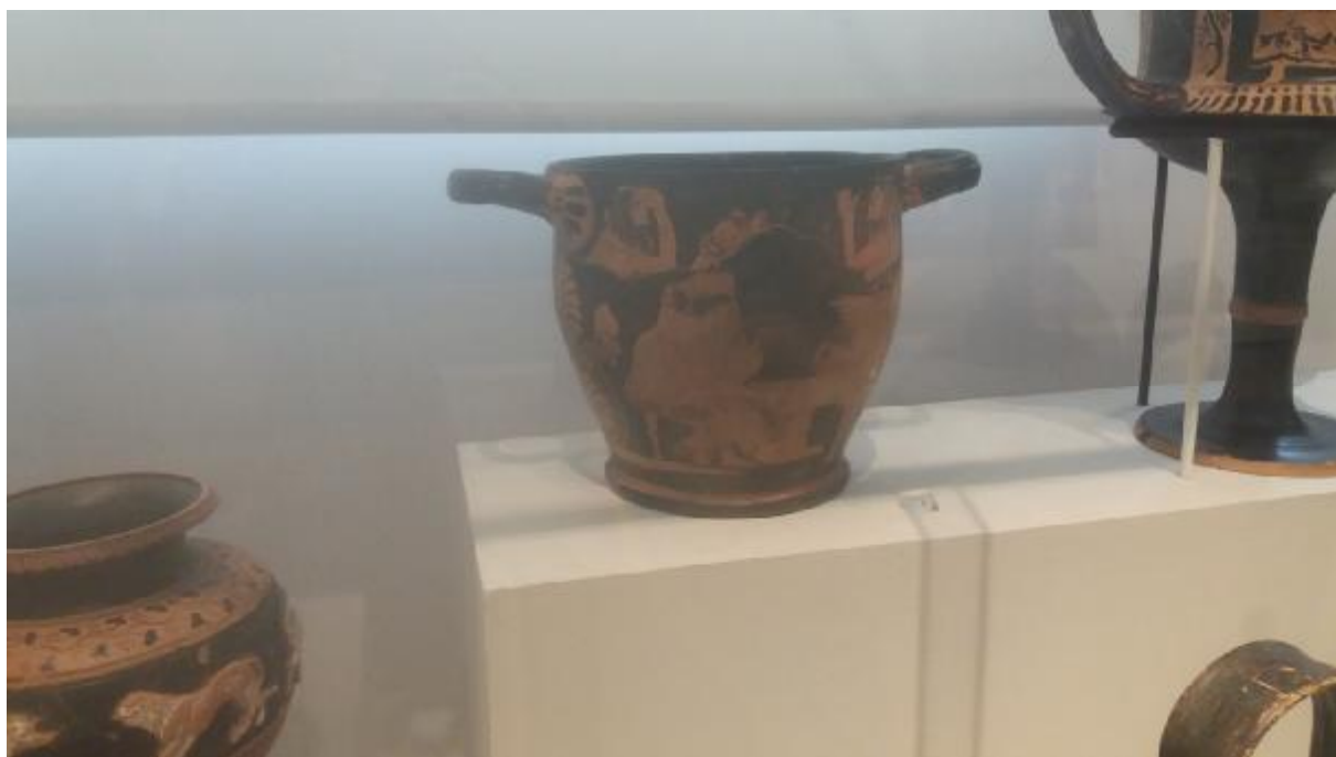
Εικόνα 18: Κεραμικό αγγείο