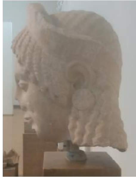
Εικόνα 16: Κεφάλι κόρης από παριανό μάρμαρο. Βρέθηκε στο Ιερό του Απόλλωνος στο Πτώο Βοιωτίας. Εκφραστικό έργο ενός ντόπιο τεχνίτη. Γύρω στο 520 π.Χ.