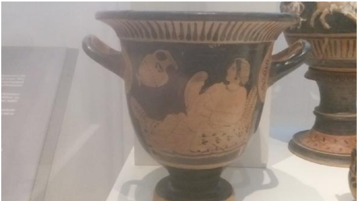
Εικόνα 17 : Κεραμικό αγγείο