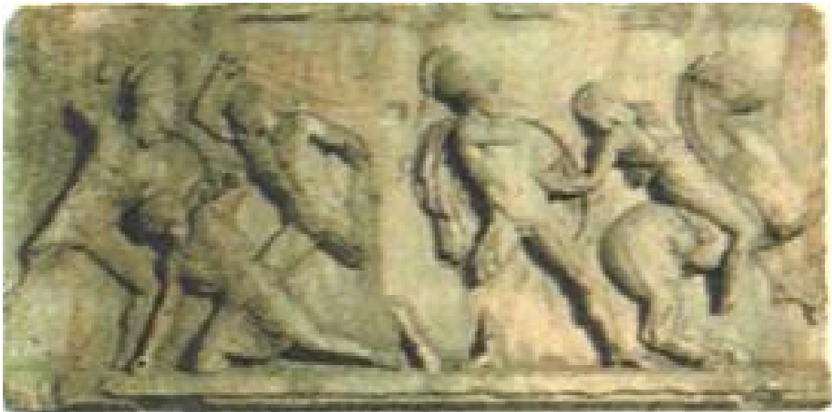
Εικόνα 4: Σκηνή αμαζονομαχίας από τη ζωφόρο του μασωλείου της Αλικαρνασσού (350 π.Χ., Βρετανικό μουσείο). Ο μύθος των αμαζόνων ενδεχομένως υποδηλώνει ότι σε παλαιότερες εποχές η θέση της γυναίκας στην κοινωνία ήταν διαφορετική.

Η γυναίκα του πλούσιου μέτοικου σχεδόν δεν ξεχώριζε από την «πολίτιδα» που είχε μια άνετη ζωή. Η εταίρα ήταν πιο ελεύθερη στις κινήσεις της από τη γυναίκα του Ισχύμαχου. Και κυρίως, επειδή η πόλη ήταν μια «λέσχη ανδρών» κι επειδή προπαντός αποτελούσε πρώτα μια πολιτική κοινότητα, αυτές οι διαφορές κατάστασης όσο ουσιαστικές κι αν υπήρξαν διαλύονταν μπροστά στον αποκλεισμό όλων αυτών των γυναικών από την πολιτική ζωή. Παρέμενε υπέρ της «πολίτιδος» μόνο το γεγονός πως με το να εξασφαλίζει την αναπαραγωγή της αστικής κοινότητας, ήταν απαραίτητη σ' αυτήν. 23