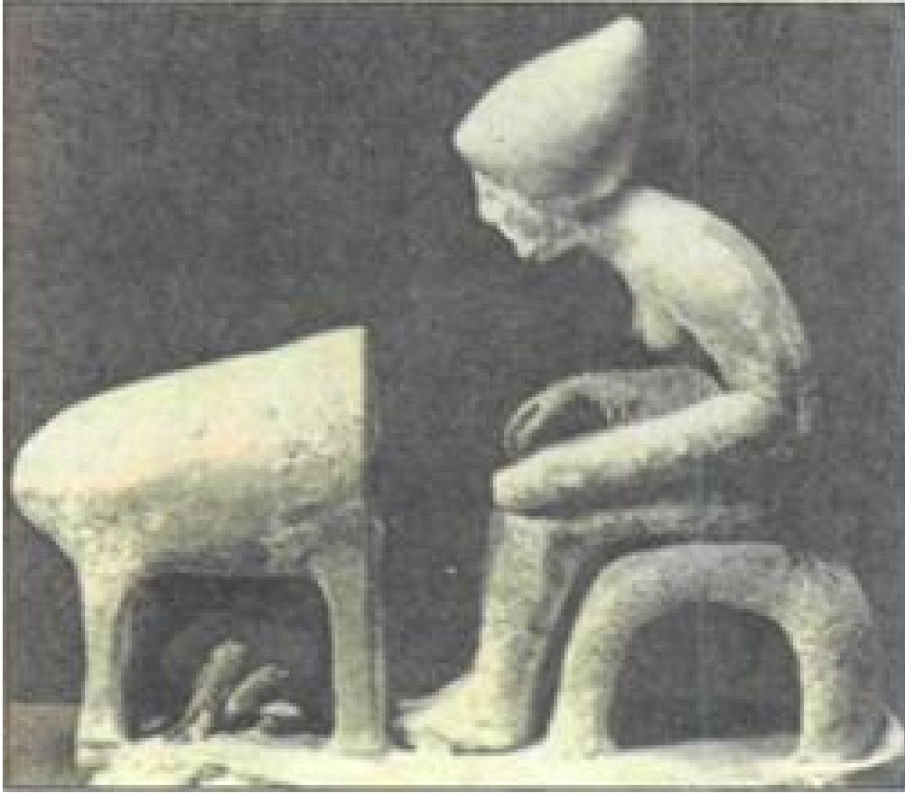
Εικόνα 3: Πήλινο ειδώλιο (τέλος του 5ου π.Χ. αιώνα, Αρχ. Μουσείο Ανατ. Βερολίνου). Εικονίζεται γυναίκα μπροστά στο φούρνο της. Οι οικιακές εργασίες ήταν έργο των γυναικών του οίκου ή γίνονταν υπό την εποπτεία τους.