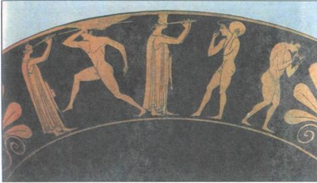
Εικόνα 6: Αναπαρασταση αθλητικών δραστηριοτήτων από αττική κύλικα (6 ος αι. π.Χ., Μουσείο Βερολίνου). Η αθλητική αγωγή, από τα αρχαϊκά μέχρι τα ελληνιστικά χρόνια, έχει αγωνιστικό χαρακτήρα.

Παράλληλα, η σωματική άσκηση των γυναικών είχε και ερωτική χροιά καθώς η παρέλαση των γυμνών κοριτσιών εκτυλίσσεται δημόσια, μπροστά στα μάτια των αγοριών με σκοπό να αποκτήσουν οι νεαροί θεατές κίνητρα για να παντρευτούν. Η γυναικεία άσκηση επομένως είχε και τη λειτουργία της κοινωνικοποίησης. 32