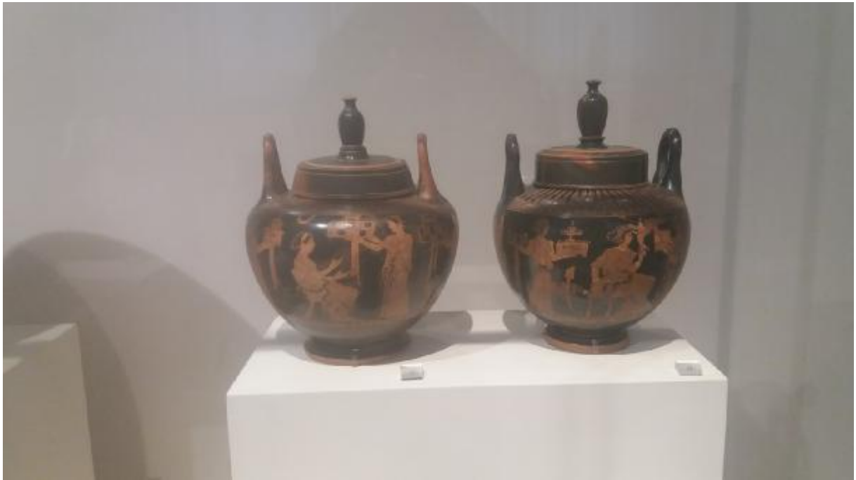
Εικόνα 20: Γαμικός λέβητας