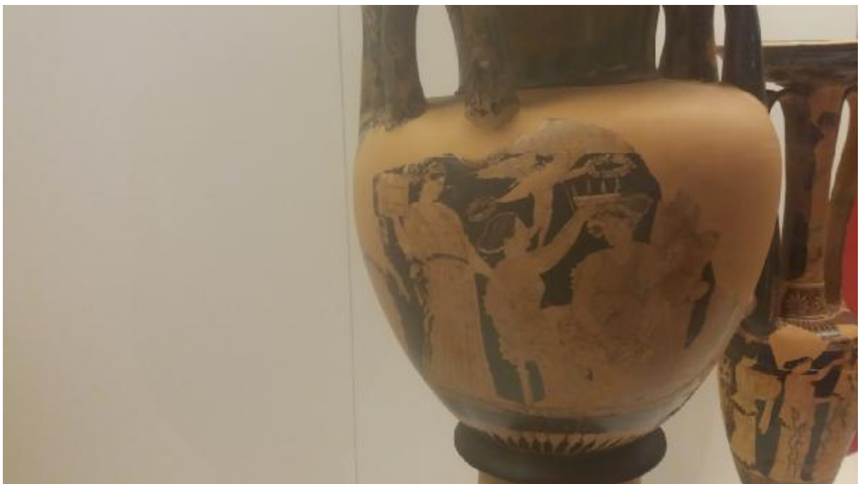
Εικόνα 21: Το στόλισμα της νύφης