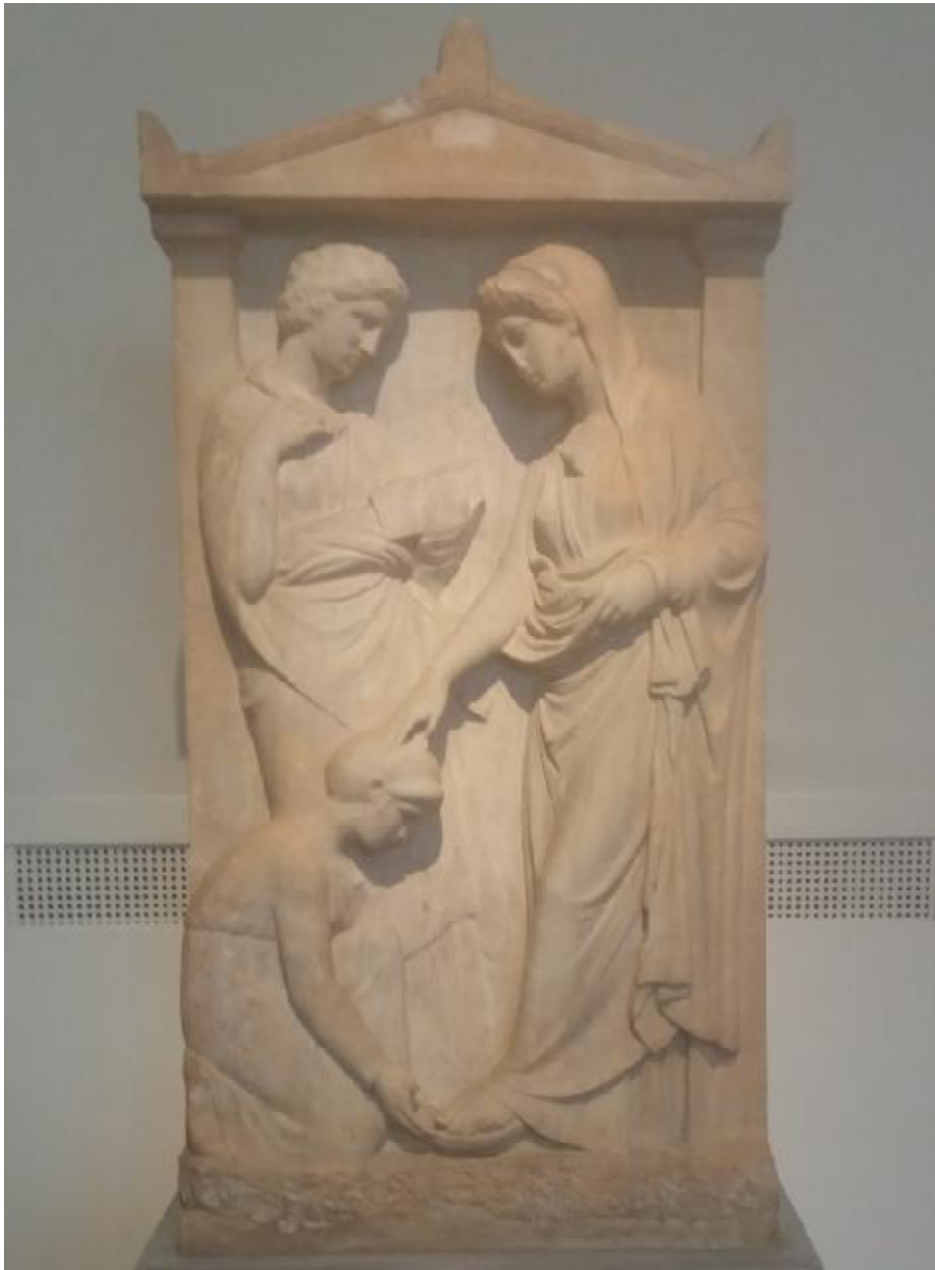
Εικόνα 13: Επιτύμβια στήλη από πεντελικό μάρμαρο. Η στήλη βρέθηκε στον Πειραιά. Μια νέα γυναίκα όρθια προς τα αριστερά στηρίζεται με το δεξί χέρι στο κεφάλι της γονατισμένης θεραπεινίδας τζς που τη βοηθά να φορέσει το σανδάλι. Στο βάθος μια άλλη γυναίκα στέκει συλλογισμένη κρατώντας την πυξίδα με τα κοσμήματα της νεκρής. Στο οριζόντιο γείσο του αετώματος της στήλης μνημονεύεται η Αμεινόκλεια, κόρη του Ανδρομένη. Η στήλη χρονολογείται το β' τέταρτο του 4 ου αιώνα π.Χ.