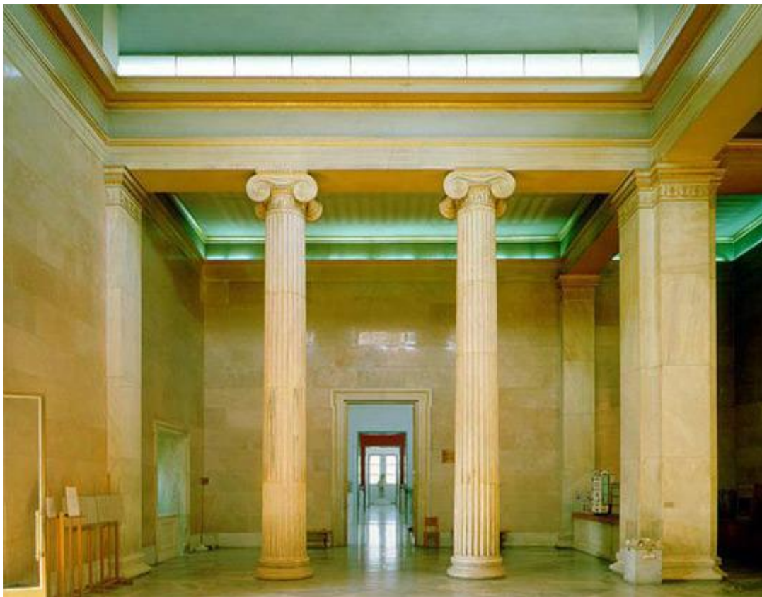
Εικόνα 9: Αποψη από το εσωτερικό του Μουσείου

την ιστορική, πνευματική και καλλιτεχνική τους αξία. Το πρώτο αρχαιολογικό μουσείο στην Ελλάδα είχε ήδη ιδρυθεί το 1829, από τον Ι. Καποδίστρια και στεγάσθηκε στο Ορφανοτροφείο της Αίγινας. Στις επόμενες δεκαετίες, όμως, η μεταφορά της πρωτεύουσας στην Αθήνα και ο μεγάλος αριθμός ευρημάτων, που ερχόταν στο φως από τις ανασκαφές, έκαναν επιτακτική την ανάγκη ύπαρξης ενός οργανωμένου εθνικού μουσείου στην πόλη. Για πολλά χρόνια διατυπώνονταν προτάσεις σχετικά με τη θέση και τα σχέδια του κτηρίου, τόσο από Έλληνες όσο και από ξένους αρχιτέκτονες, που εργάζονταν για την ανοικοδόμηση της Αθήνας. 36