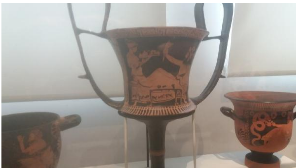
Εικόνα 19: Γυναικεία μορφή σε νυφική καλύπτρα