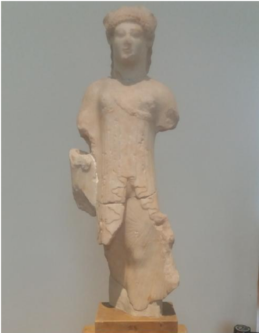
Εικόνα 15: Αγαλμάτιο κόρης από παριανό μάρμαρο. Βρέθηκε στην Ελευσίνα. Φορά χειριδωτό χιτώνα και ιμάτιο. Με το αριστερό χέρι ανέσυρε τον χιτώνα. Γύρω στο 490-480 π.Χ.