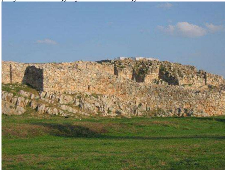
Η άνω ακρόπολη και ο δυτικός προμαχώνας από δυτικά

Η ακρόπολη των Μυκηνών κατείχε στρατηγική θέση στην Αργολική πεδιάδα την Ύστερη Εποχή του Χαλκού στην Ελλάδα. Είναι το βασίλειο του μυθικού Αγαμέμνονα και οι μύθοι που σχετίζονται με την ιστορία, τους ηγεμόνες και τα μέλη της οικογένειάς τους (όπως η Κλυταιμνήστρα, η Ιφιγένεια, η Ηλέκτρα, ο Ορέστης) που εμπνεύστηκαν ποιητές, συγγραφείς και καλλιτέχνες όλων των εποχών.