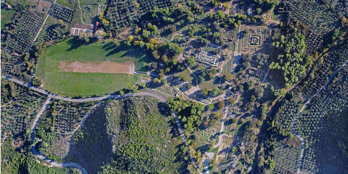
Αεροφωτογραφία του Αρχαιολογικού χώρου της Ολυμπίας