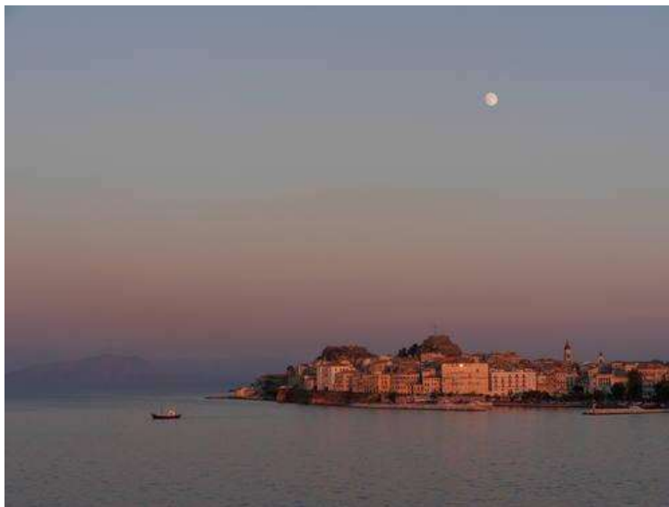
Η Παλιά Πόλη της Κέρκυρας