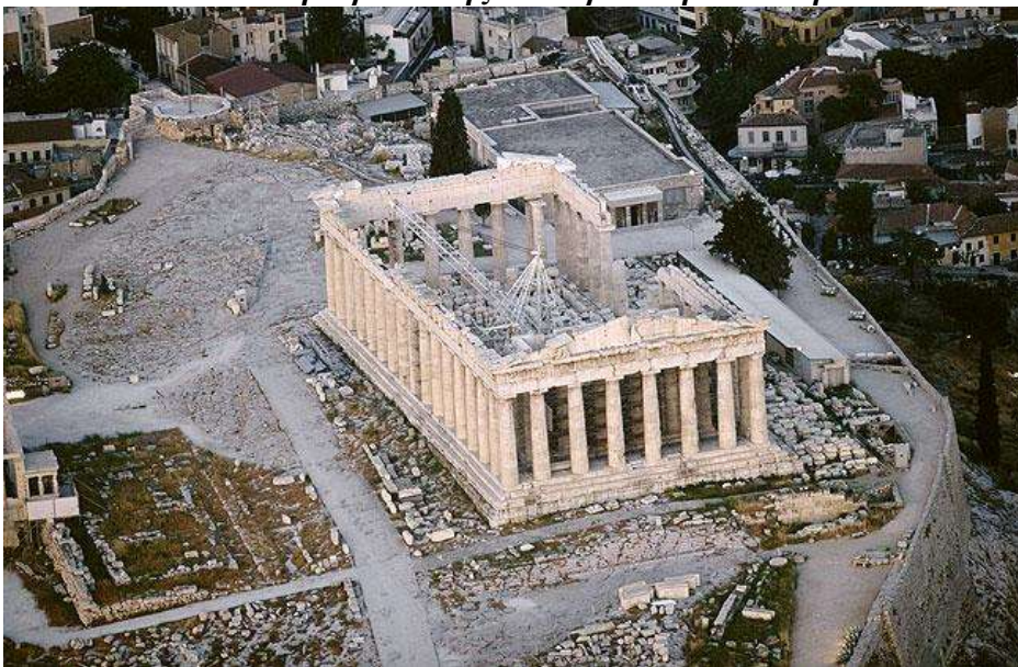
Αεροφωτογραφία του Παρθενώνα