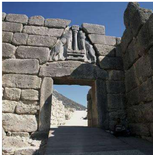
Η Πύλη των Λεόντων