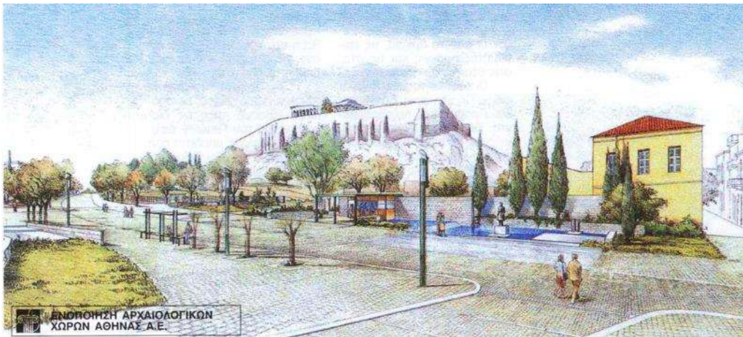
Σχέδιο διαμόρφωσης περιβάλλοντος χώρου στη συμβολή των οδών Μακρυγιάννη και Διονυσίου Αρεοπαγίτου

Τα προαναφερόμενα έργα δεν αυξάνουν τόσο τη σταθερότητα και την ευκρίνεια των μνημείων, αλλά εξασφαλίζουν την οπτική επαφή του επισκέπτη με την τελειότητα των αρχαίων οικοδομικών τεχνικών. Παρά τις φθορές που έχουν υποστεί τα μνημεία από τις ανθρώπινες και φυσικές δυνάμεις, η Ακρόπολη των Αθηνών μεταδίδει απόλυτα τη μεγαλοπρέπεια και την ιδέα της Δημοκρατίας (UNESCO, 2019).